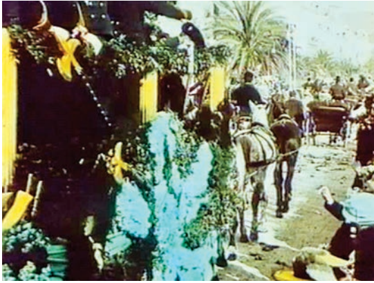
1 CORTÈGE FLEURI (anonym, F 1900)

ebenso gesättigtes, leuchtendes Türkis und ein paar wässrige, transparente Nuancen (schwaches Grün, Blassblau, Bräunlich-Orange). Goldgelb und Türkis, die beiden Haupttöne und eigentlichen Protagonisten der kleinen Szene, bilden einen frischen Farbkontrast, der das Bild belebt. Sie gelten vor allem dem Blumenwagen im Zentrum des Bildes, doch auch ein paar Kleidungsstücke aus der Menschenmenge – ein Hut in Türkis, ein anderer in Goldgelb rechts vorn – sind, wie um des kompositorischen Gleichgewichts willen, ebenfalls mit Farbe akzentuiert. Die bunten Flecken verspannen das sich bewegendes Bild auf unvorhersehbar wechselnde Weise in immer wieder anderer Kombination. Sie betonen seine Oberfläche, auch wenn durch die fahrenden Wagen ein deutlicher Zug in die Tiefe zu verzeichnen ist. 5