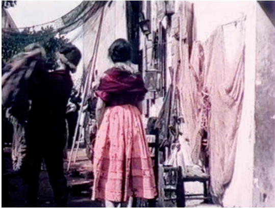
3 STELLINA, LA PESCATRICE DI VENE- ZIA (Itala Films, I 1912)

Das Paar erreicht den Kai, er küsst sie zum Abschied väterlich auf die Stirn und besteigt mit anderen Fischern ein Segelboot. Die Männer und ausfahrenden Schiffe sind braun belassen bis auf die besagte Jacke des Vaters, die wiederum leichte Spuren von Brombeerrot trägt. Das Meer zeigt einen Anflug von Hellblau, die Boote spiegeln sich im Wasser. Die Palette ist stark reduziert, lediglich ein kleiner Ausschnitt des Spektrums kommt zum Zuge. Auch in diesem Filmausschnitt ist nur ein schwacher Impuls zu erkennen, eine naturalistische Simulation natürlicher Farbgebung zu erreichen: Zwar ist das Meer blau, doch viel weiter geht die Naturbeobachtung nicht – die Farbe der Kleidung darf der Fantasie entspringen, und der Hintergrund, der die Figuren umgibt, folgt primär ästhetischen, atmosphärischen Prinzipien.