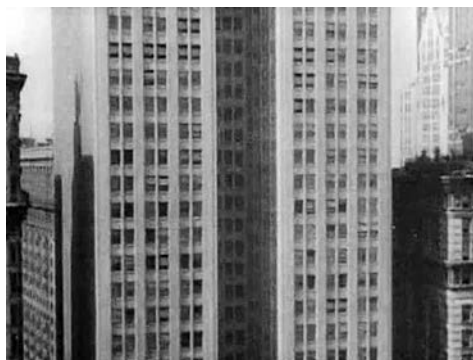
Stills aus MANHATTA (Charles Sheeler/Paul Strand, USA 1921)