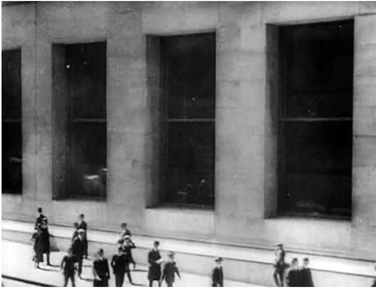
1 MANHATTA (Charles Sheeler/ Paul Strand, USA 1921)

MANHATTA zeugt von der wechselseitigen Durchdringung der Künste in dieser Zeit. Der Film gilt als durchkomponiertes Stadtpoem, als filmisches Tableau New Yorks. Er basiert auf verschiedenen Kunstformen wie Malerei und Fotografie und bildet wiederum die Basis für weitere Werke. Charles Sheeler und Paul Strand deklinieren das Bildmaterial förmlich durch verschiedene Sparten; Strands Fotografien kehren im Film als Bewegtbild aus gleicher Perspektive wieder, Sheeler nimmt Einstellungen des Films als Vorlage für seine Gemälde. Stills aus MANHATTA wurden damals wie heute bei Ausstellungen zusammen mit den Gemälden und Fotografien der Künstler gezeigt.