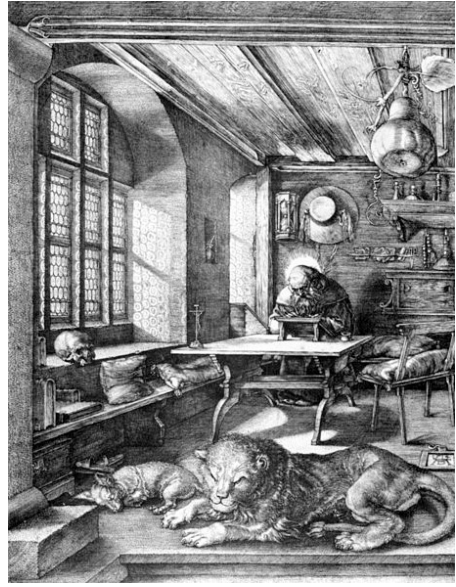
1-2 Der heilige Hieronymus im Gehäus links von Antonello da Messina (um 1474) und rechts von Albrecht Dürer (1514)

bei dem die geringere Distanz und der leicht schräge Winkel die Wirkung von Intimität und den Eindruck «einer nicht durch die objektive Gesetzlichkeit der Architektur, sondern durch den subjektiven Standpunkt des gerade eintretenden Beschauers bestimmten Darstellung» hervorrufen (ibid., 124). In gewisser Weise «ergreifen» die Nähe und der Blickwinkel den Betrachter und ziehen ihn ins Gemälde hinein.