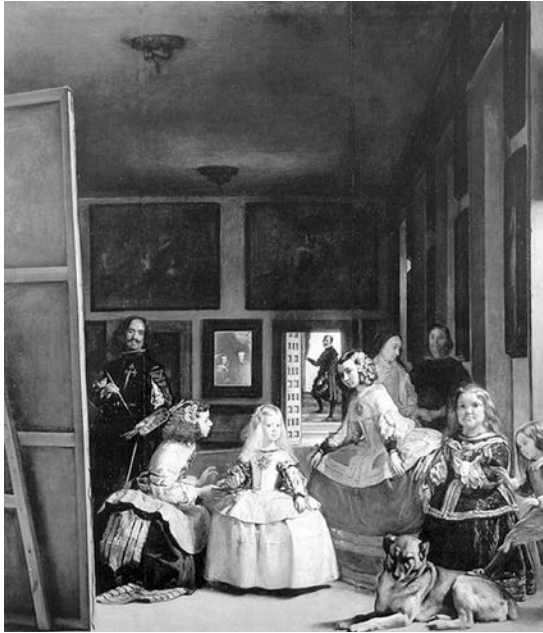
3 Las Meninas von Diego Velázquez (1656)

im Fluchtpunkt befindet (es handelt sich bekanntermaßen um König Philipp IV. und seine Frau). Was diesen aber in der Szene Präsenz und Notwendigkeit verleiht, sind die Blicke aller Figuren im Bild, die auf sie gerichtet sind, während man für den Maler posiert, der im Selbstporträt zu sehen ist. Auf die allgemeinen Implikationen dieser Repräsentation, die Michel Foucault (1971 [1966]) analysiert hat, werde ich nicht weiter eingehen. Betonen möchte ich lediglich die Kühnheit, ja Anmaßung dieser Verführungskunst, die den Betrachter nachgerade zu der Annahme zwingt, dass sich die Szene über die Ränder des Gemäldes hinaus erstreckt; die ihn gleichzeitig innen festhält und nach außen stößt; die die Macht der Darstellung vervielfacht, das Nichtdargestellte, wenn nicht gar das Nichtdarstellbare anzudeuten; und die ihn einen unendlichen Raum erahnen lässt.