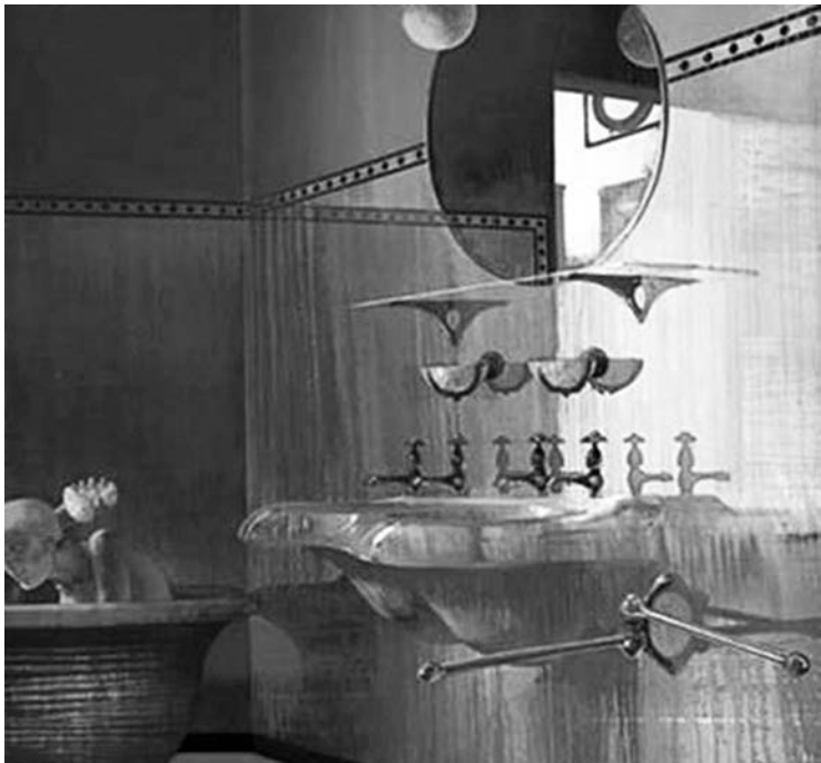
Le parentesi dell'acqua von Leonardo Cremonini (1968)