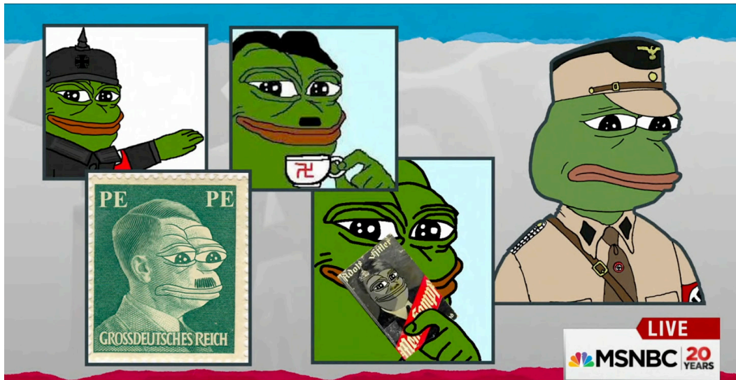
Abb. 1: Pepe der Frosch als Nazi. Quelle: Screenshot Minute 3:43, The Rachel Maddow Show: Trump employs symbols of America's racist fringe , 17.09.2016, https://www.nbcnews.com/dateline/video/trump-employs-symbols-of-us-racist-fringe-767279683702 .

modifizierung noch wenige Monate zuvor so verteuft hatten. Eine zweite Strategie, ihn von den ›Normies‹ oder ›Normalfags‹ zurück zu erobern, lag darin, den Frosch vor allem mit Nazi-Propaganda, Hakenkreuzen, rassistischen und antisemitischen Aussagen zu verbinden und ihn auf diese Weise sozial zu diskreditieren. Zeitgleich geschah Folgendes: Im Juli 2015 postete jemand ein Bild im /pol/-board von 4chan, auf dem ›Smug Pepe‹ mit Trump-Toupet vor einem Zaun an der US-amerikanisch-mexikanischen Grenze steht, hinter dem Zaun traurig aussehende Mexikaner. Diese Verbindung von Pepe und Trump gewann schnell an Popularität und im Oktober desselben Jahres retweetete Trump erstmals selbst ein Bild von Trump Pepe. Im März 2016 erschien ein Artikel auf der rechten Nachrichtenseite Breitbart News, der mittlerweile als Manifest der sogenannten Alt-Right-Bewegung gilt: An Establishment Conservative's Guide To The Alt-Right , illustriert mit Pepe. 29