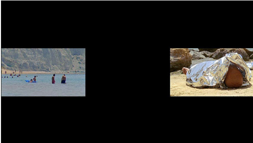
Abb. 3: Isaac Julien, Western Union: Small Boats , 2007, 18. Mins., Colour, 35 mm, DVD Transfer, Sound.

lokation des Subjekts bedeutet, also den Ausschluss aus familiären Territorien und die (erzwungene) Emigration in einen anderen Raum, sondern in gleichem Maße die mediale Konzeptualisierung einer Erfahrung der Alterität in den medialen Künsten meint.