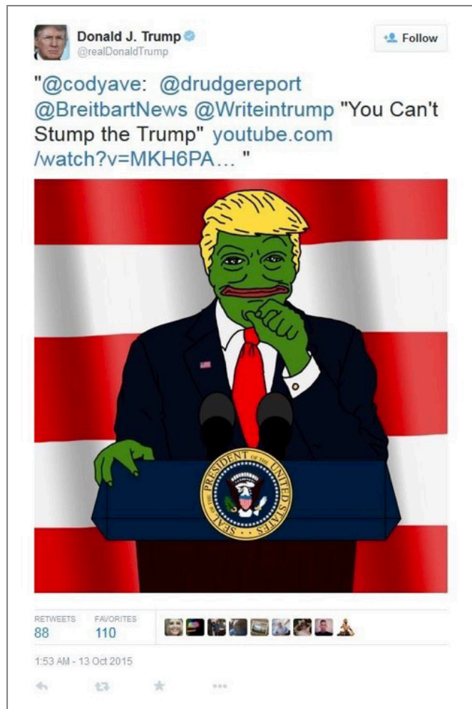
Abb. 2: Tweet von Donald Trump mit Trump-Pepe. Quelle: https://web.archive.org/web/20151013101302/https://twitter.com/realDonaldTrump/status/653856168402681856

Damit ist die Verbindung von Pepe, weißen Suprematisten und Donald Trump besiegelt. Im August wird der Breitbart Aufsichtsratsvorsitzende Steve Bannon zu Trumps Wahlkampfleiter, seine weitere Karriere ist ebenfalls bekannt. Im selben Monat spricht Hillary Clinton in einer Wahlkampfrede erstmals über die Ideologie der Alt-Right-Bewegung. Dabei wird ihre Wahlkampfrede von einem Pepe-Rufer unterbrochen, der seine Störung kurz zuvor – natürlich auf reddit – angekündigt hatte. Im Zuge dessen findet Pepe seinen Weg erneut in den ›Mainstream‹, dieses Mal in die traditionellen Medien, vor allem das Fernsehen: NBC, MSNBC, CNN versuchen sich an Erklärungen, bezeichnen den Frosch als ›white nationalist symbol‹, ›white supremacist symbol‹, andere Medien greifen das auf. Im September bezeichnet Clinton in einer erneuten Rede die Trump-Unterstützer als ›basket of deplorables‹, am nächsten Tag retweetet Trumps Sohn ein Bild mit derselben Bildunterschrift. Neben seinen Söhnen, Mike Pence, Rudolf Giuliani und Milo Yiannopoulos, dem damaligen Poster-Boy der Alt-Right und Verfasser des