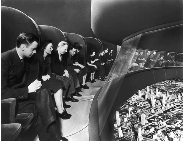
2 Der von Norman Bel Geddes konstruierte Futurama-Pavillon (1939)

projektiert war, ließ sich die fünfzehnminütige Zugfahrt komfortabel zurücklegen. Ein vorab auf 150 separaten Filmstreifen aufgezeichneter Vortrag wurde von einer Vorführkabine aus eingespielt, je nachdem, wo sich die Wageninsassen gerade befanden. 4 Die Fahrt verband neueste Techniken zur Aufnahme, Wiedergabe und Verstärkung des Tons, wie sie sich als modernster Standard in Kinos und bei portablen Projektoren durchzusetzen begannen (vgl. Fotsch 2001, 64–97).