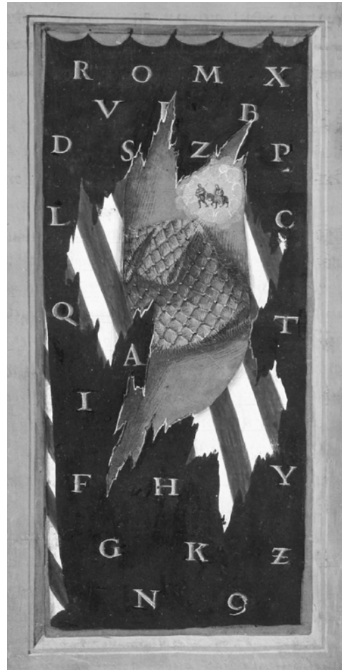
Abb. 1: Umkreis Noël Bellemare: Stundenbuch , ca. 1524, Tours (?), fol. 37v.

am Vorabend von Epiphania) sollten die Vorhänge der Tribüne, die den Kaiser als vergöttlichten Menschen der Menge offenbarten, nach dem Text eines Hymnus Wolken versinnbildlichen. 30 Das Loch öffnet das Bild auf das biblische Geschehen hin, das aufgrund der Operation des zerrissenen Vorhangs nun aber nicht als abwesendes repräsentiert wird, sondern dessen Anwesenheit im Raum des Betrachters tele-visioniert wird. Es handelt sich bei dieser Öffnung mithin um eine Interpretation der bei Darstellungen von Visionen und Erscheinungen üblichen Mandorla, die die Mandorla als materielle Operation, die am Vorhang bzw. Bildgrund vorgenommen wurde, deutet. Das Medium attestiert hier also nicht nur die Wahrhaftigkeit des Bildes, sondern auch die Sakramentalität des Vorhangs, der als Bildschirm-Medium zwischen heiliger Familie und Betrachter fungiert. Der Vorhang, sagte Jacques Lacan im Hinblick auf seine Verwendung im Kult, 31 ist das Götzenbild der Abwesenheit. 32 Man kann sagen, »daß mit der Anwesenheit des Vorhangs das, was jenseits ist als Mangel, danach strebt, sich zu realisieren als Bild. Auf dem Schleier malt sich die Abwesenheit.« 33