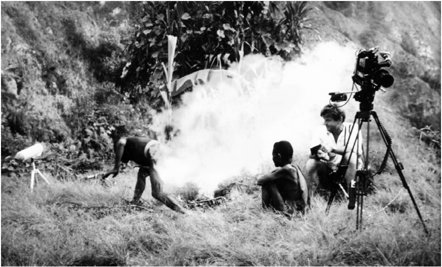
Irenäus Eibl-Eibesfeldt, Felddaufnahmen bei den Eipo (1978)

Diese Langzeitstudien liefern der Humanethologie im Laufe der Jahre die Datenbasis, die 1967 noch so schmerzlich vermisst wurde: das Humanethologische Filmarchiv, bestehend aus insgesamt 700 Stunden 16mm-Filmmaterial sowie 100 Stunden Videoaufzeichnungen, mehr als 1800 Stunden Tonaufnahmen und reichhaltigen Metadaten. Nach der Emeritierung von Eibl-Eibesfeldt und der Abwicklung der humanethologischen Abteilung des MPI in Andechs wurde die Sammlung 2014 vom Senckenberg Institut und Naturmuseum Frankfurt übernommen.