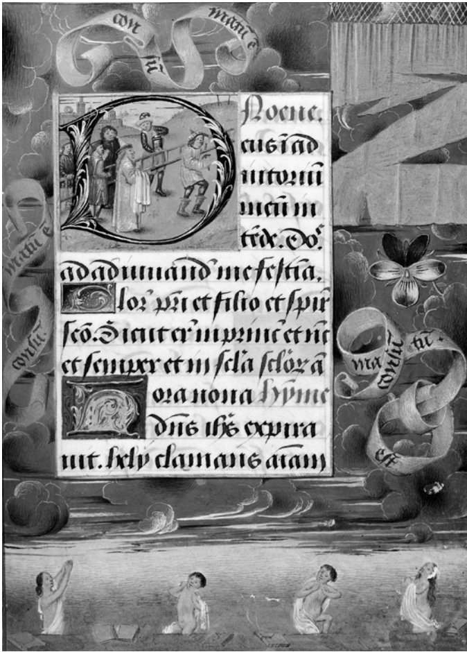
Abb. 3: Stundenbuch , um 1478, Bibliothèque d’Arsenal Paris, Ms. 1185 reserve, fol. 199r.

der Gegenwart des Lesers/der Leserin. Das Trompe-l’œil als ein Bild-Zeichen, das dabei ist, ins Register des Realen zu wechseln, stellt so die Verbindung zwischen dem Vorhang im Tempel aus der Passionsgeschichte – und dem damit verbundenen apokalyptischen Geschehen – und den materialiter in Stundenbüchern eingenähten Vorhängen dar. Die von der Benutzerin in der eigenen Motorik gespeicherte Geste des Öffnens des Vorhangs wird durch das Trompe-l’œil aktiviert und gekoppelt mit dem Vorhang, der das Allerheiligste im jüdischen Tempel verbarg; das Zerreißen des Vorhangs und das damit verbundene Wahrheits-, Rechts- und Erlösungsgeschehen wird ins Zeitalter seiner technischen Reproduzierbarkeit überführt.