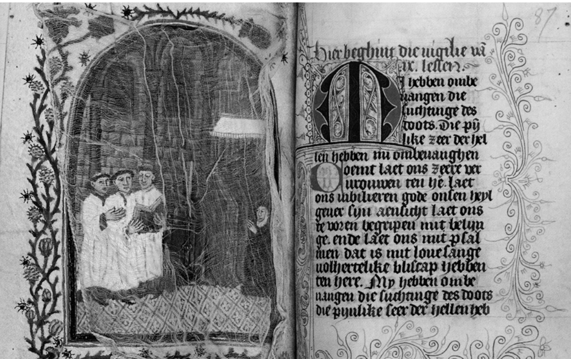
Abb. 2: Totenmesse mit betender Nonne, Miniatur, Stundenbuch aus Südholland (Delft?), ca. 1440–60, Den Haag, Ms. 130 E 18, fols 86v–87r.

Tempel in der Stunde des Todes Jesu Christi. Das Blatt ist das letzte einer Reihe von Miniaturen, die die Passionsgeschichte darstellen. Es zeigt in der Initiale Nikodemus, Josef von Arimatäa, Maria Magdalena et al., wie sie mit Leiter und Lechentuch zur Kreuzabnahme schreiten (Abb. 3, S. 108). Die Bordüre hat sich zu einem den Textblock hinterfassenden Vollbild entwickelt, das am unteren Rand die Auferstehung der Toten zeigt und sonst mit grauem Sturmgewölk angefüllt ist. Allein in der oberen rechten Ecke hängt ein z-förmig zerrissener, hellblauer Vorhang, der mittels eines rhombenartigen Netzes von Fäden an die obere Rahmenleiste der Bordüre angenäht ist. 38 Das damit zur Anwendung kommende Trompe-l'œil verbindet den Vorhang mit der Materialität des Buches und damit zugleich mit