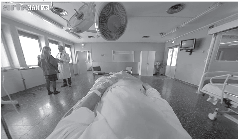
3 Passiver, an die Sichtposition der Rezipierenden gekoppelter Körper in I, PHILIP

Der virtuelle Körper wird sichtbar, wenn die Rezipierenden ihren Kopf nach unten neigen. Der abgebildete Körper ist plötzlich an die Sichtposition der Rezipierenden gekoppelt (vgl. Abb. 3). Je weiter sie ihren Kopf nach unten neigen, desto mehr sehen sie von diesem Körper. Diese visuelle Nähe zu einem fremden Körper kann im ersten Moment desorientierend wirken, da die Rezipierenden einen virtuellen Körper sehen, der visuell nicht ihrem leiblichen Körper entspricht und den sie nicht steuern oder bewegen können.