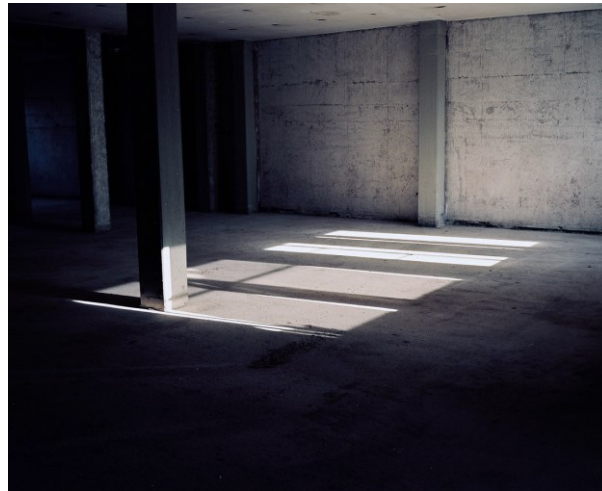
Abb. 2: Innenbereich im ehemaligen Hauptpostgebäude KAP1, Düsseldorf 2018

Mit dem durchaus markanten Bau aus den 1970er-Jahren wurde eine Stelle in der Stadt überschrieben, die reicher an bühnenbezogenen Referenzen kaum sein könnte. Sie verweisen auf eine Zeit, als die Gegend am Ende der Königsallee um den Graf-Adolf-Platz herum Bahnhofsgegend war. Der Funktion nach der Mobilität gewidmet, war schon damals für eine Reputation gesorgt, an der sich bis heute nicht viel geändert hat. Mit der Verlegung des Bahnhofs während der Gründerjahre an seinen gegenwärtigen Standort wuchs die Stadt weiter, entsagte der Vielzahl an Kopfbahnhöfen und machte aus dem damaligen Stadtrand ein lukrativ gut angebundenes und vernetztes Terrain für Spekulationen und Entrepreneurship. Die Fabriken wuchsen und mit ihnen die Viertel als Teil einer Dynamik, die von den unterschiedlichsten Kräften und Interessengruppen entwickelt wurde.