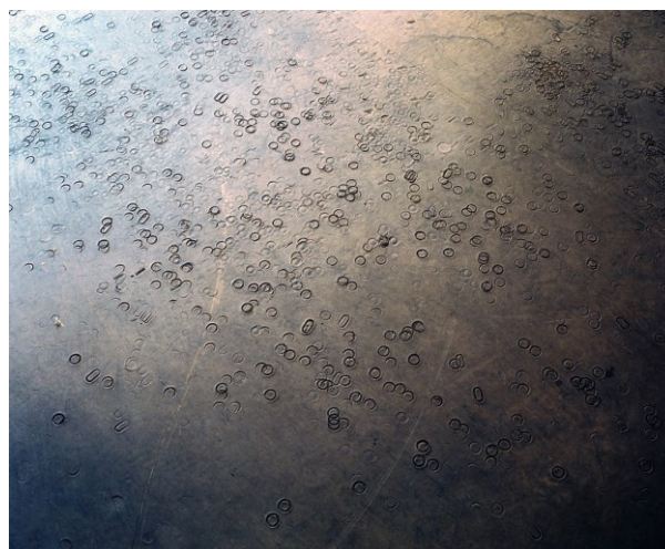
Abb. 1: Bodenbelag im ehemaligen Hauptpostgebäude KAP1, Düsseldorf 2018

Entstehen und Verschwinden, Produktion und Abfall, Planen, Aufbau und Wachstum wie Abriss und Zerstörung sind untrennbarer Teil dessen, was sich in das Gesicht der Städte schreibt. Zwischen Zäsuren wie der des Krieges, des Wiederaufbaus der zerstörten zur „autogerechten“ Stadt oder des Verschwindens der industriellen Produktionsstandorte entstehen immer wieder Orte, die es ermöglichen, diese Geschichte(n) zu reflektieren; Orte, die für Praxen im städtischen Raum stehen, die keiner unmittelbar ökonomischen Zielsetzung folgen. Austragungs- und Spielorte scheinbar sinnloser, großzügiger Gesten; Gesten der Sprache und des Bildes, solche die Zeitmomente festhalten und solche, die sich in ihrer Flüchtigkeit nicht festhalten lassen (wollen).