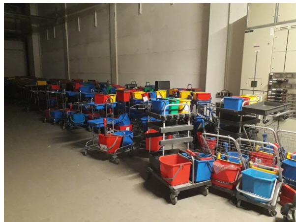
Abb. 4: Putzmittellager im ehemaligen Hauptpostgebäude KAPI, Düsseldorf 2018

Im Zuge der Umnutzung der ehemaligen Hauptpost zum kulturellen Hub stehen größere architektonische und städtebauliche Veränderungen im und am Gebäude an.