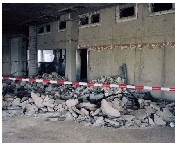
Abb. 6: Bauarbeiten im ehemaligen Hauptpostgebäude KAP1, Düsseldorf 2018

Theater als ein Ort der Versammlung und einer künstlerischen Praxis des Flüchtigen – funktioniert es als Ort der Vergesellschaftung? Als ein Moment, der die auf Wertschöpfung zielenden Prozesse in Frage stellt und ihnen widerspricht? Der für eine Kunst der Verausgabung, der Verschwendung, des Festes steht? Was genau ist gemeint, wenn wir über das Fehlen von oder das mangelnde Interesse an Aushandlungsprozessen und Beteiligung in der Stadtgesellschaft sprechen? Welches Wissen und welche Ressourcen können Bühne und Theater an dieser Stelle zur Verfügung stellen? Wie können die Praxen des Planens und Entwerfens, des kollektiven Produzierens und modellhaften Erprobens sozialer Beziehungen für die städtische Öffentlichkeit (über den Besuch einer Theatervorstellung hinaus) eine lebendige Bedeutung erhalten? Wo wirken die Interessen der unterschiedlichen Akteure zusammen; wo geraten sie in Konflikt; an welcher Stelle artikuliert sich Protest?