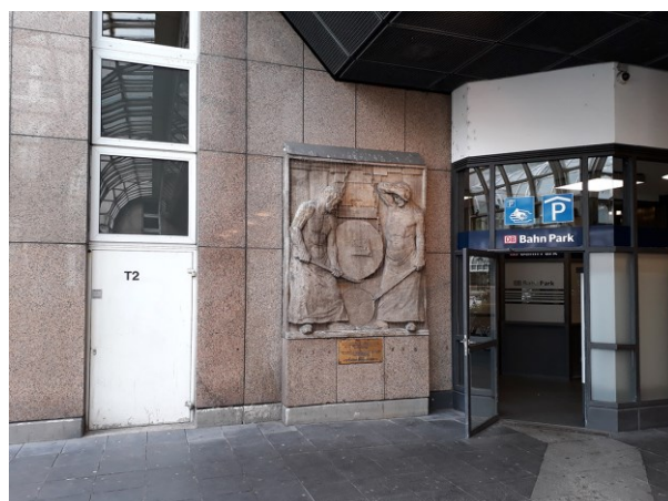
Abb. 3: Erinnerung an den Stahlstandort Düsseldorf-Oberbilk, Hauptbahnhof, Düsseldorf 2018

Mit dem durchaus markanten Bau aus den 1970er-Jahren wurde eine Stelle in der Stadt überschrieben, die reicher an bühnenbezogenen Referenzen kaum sein könnte. Sie verweisen auf eine Zeit, als die Gegend am Ende der Königsallee um den Graf-Adolf-Platz herum Bahnhofsgegend war. Der Funktion nach der Mobilität gewidmet, war schon damals für eine Reputation gesorgt, an der sich bis heute nicht viel geändert hat. Mit der Verlegung des Bahnhofs während der Gründerjahre an seinen gegenwärtigen Standort wuchs die Stadt weiter, entsagte der Vielzahl an Kopfbahnhöfen und machte aus dem damaligen Stadtrand ein lukrativ gut angebundenes und vernetztes Terrain für Spekulationen und Entrepreneurship. Die Fabriken wuchsen und mit ihnen die Viertel als Teil einer Dynamik, die von den unterschiedlichsten Kräften und Interessengruppen entwickelt wurde.