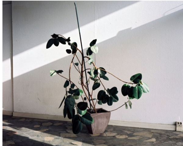
Abb. 7: Pflanzenbestand der bis Jahresende 2017 im Hauptpostgebäude KAP1 befindlichen Postkantine, Düsseldorf 2018

Die sich nun unversehens vollziehende Partizipation des Theaters am Stadtumbau eröffnet die Möglichkeit einer reflektierenden und einfordernden Beobachtung und Beteiligung. Zwangsläufig folgt das Theater mit der Aufgabe seiner bisherigen Spielstätten zunächst der Logik des Ausverkaufs öffentlich-städtischen Eigentums. Sein neuer Standort findet sich ausgerechnet in einer Logistik-Ruine der ehemaligen Bundespost in der Nähe des Hauptbahnhofs, wo mit der investitionsschweren Neugestaltung des Bahnhofsviertels nicht nur gleich ein ganzes Kulturquartier, sondern mit dem Bahnhofsvorplatz auch das öffentliche Bild der Stadt mit entworfen wird.