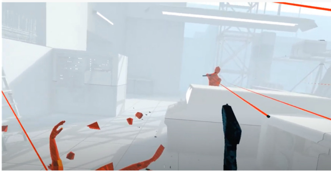
Abbildung 4: Gegner*innen und Spieler*innenperspektive in SUPERHOT