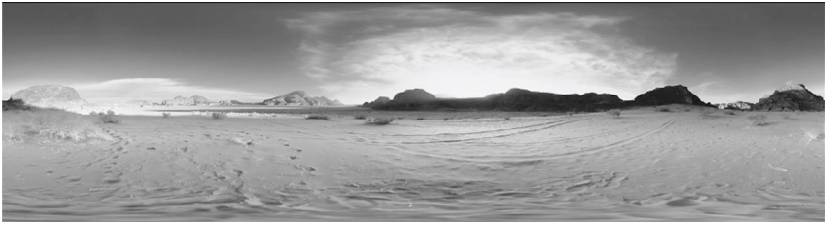
Abbildung 6: Filmstill der unberührten Wüstenlandschaft als VR-Filmeinstieg in CLOUDS OVER SIDRA