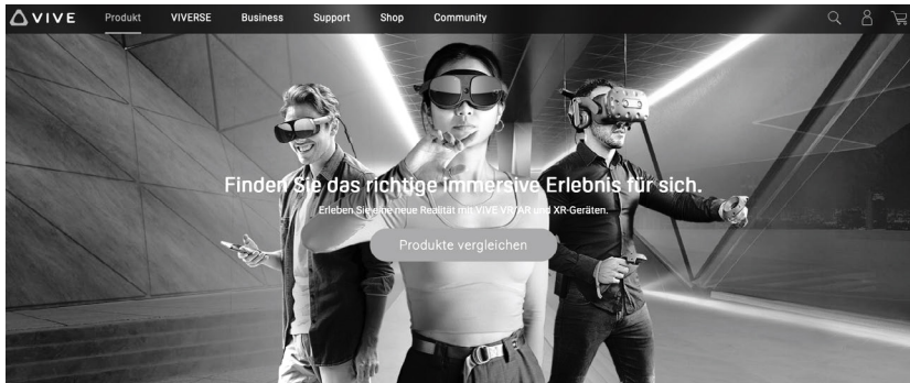
Abbildung 3: Vermarktung der HTC Vive Modelle auf der Vive Homepage