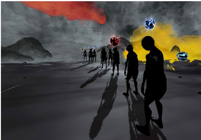
Abbildung 9: Still der grauer werdenden Welt und wartenden Gestalten in THE KEY