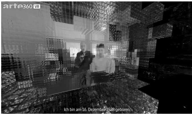
Abbildung 5: Aufbau des fotorealistischen Bildes in I, PHILIP