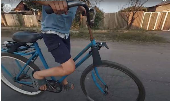
Abbildung 7: Filmstill aus THE DISPLACED von der Kamerahaltung an Olegs Fahrrad