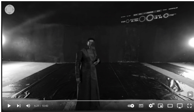
Abbildung 11: Filmstill mit Blick auf die Bildstörung in LET THIS BE A WARNING