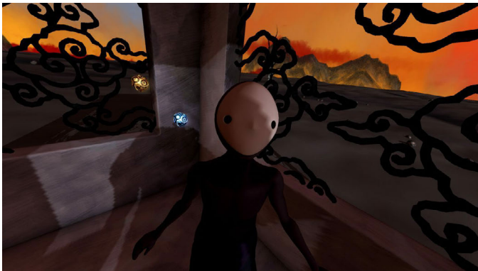
Abbildung 8: Still der von mir verkörperten Figur in THE KEY