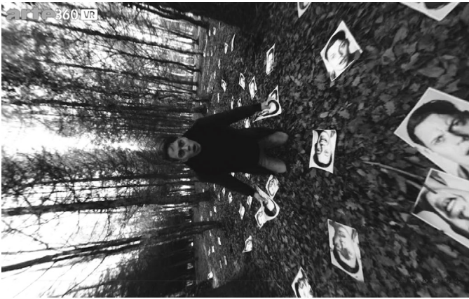
Abbildung 10: Filmstill des vertikalen Horizonts in ALTERATION