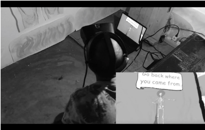
Abbildung 12: Installationsraum von MY BODY IS NOT YOUR BODY