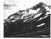
The Transposition of Ecological Patterns in Nature to the Zoo Site ....