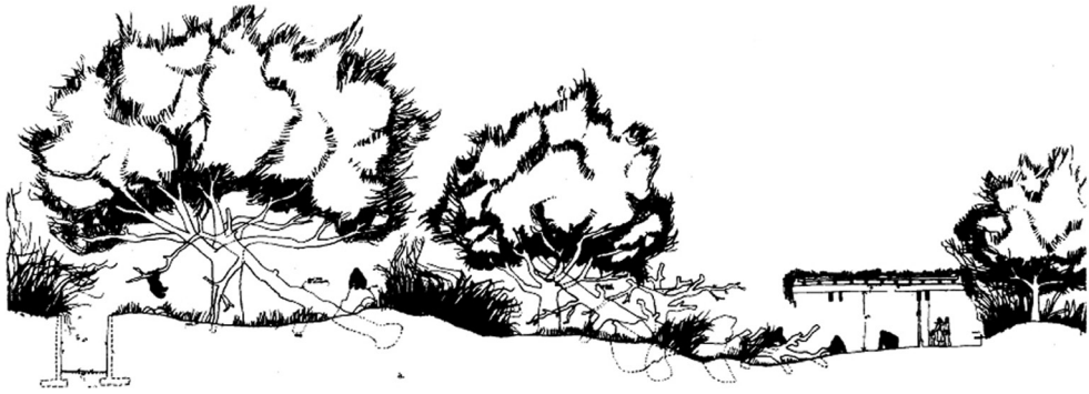
5 Gorilla Exhibit, Entwurfszeichnung Querschnitt (© Jones & Jones 1976)

Zooplanung integriert und Beschreibungen der Forscherinnen von Waldlichtungen von Rio Muni im westlichen Afrika wurden für das Entwurfskonzept der Gorillanlage genutzt. Die künstliche Version des Habitats sollte sowohl dem Verhalten der Westlichen Flachlandgorillas entsprechen, als auch den Besuchern einen möglichst realistischen Eindruck des ursprünglichen Habitats vermitteln. Das Besondere der neuen Außenanlage der Gorillas war, dass sie mit lebenden Pflanzen ausgestattet wurde, die von den Tieren genutzt, also beispielsweise beklettert und gefressen werden konnten. Um die Sichtbarkeit der Gorillas zu gewährleisten, wurden für Gorillas interessante Wahrnehmungsphänomene wie Heizsteine, ein Wasserfall, Stroh, Sitzflächen und Kletterbäume mit den Blickachsen der Besucher in Beziehung gesetzt. Das funktional notwendige Tierhaus, ursprünglich für die Bärenhaltung errichtet, wurde hingegen durch Vegetation und Kunstfelsen visuell vom Besucherweg abgeschirmt (vgl. Greene 1987: 64–67).