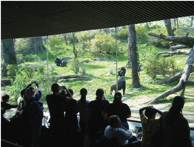
7 Congo Gorilla Forest, Wildlife Conservation Society, New York