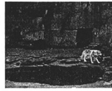
The Reading of the Actual Site to Reveal its Inherent Potential.....