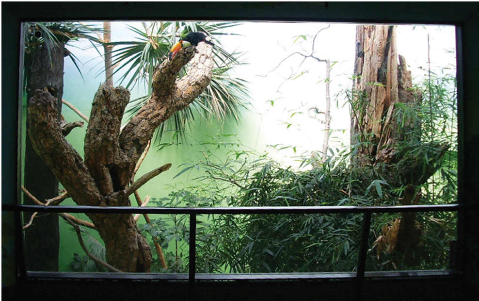
6 World of Birds, Wildlife Conservation Society, New York

che Trennung zwischen dem erleuchteten Gehege und dem verdunkelten Betrachterraum vorgesehen ist. In der World of Birds werden die diorama-artigen Schaugehege schließlich mit reich bepflanzten, zylindrischen Freiflugvolieren unterbrochen, die für die Besucher über Balkone zugänglich sind.