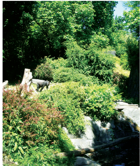
4 Gorilla Exhibit, Woodland Park Zoo, Seattle