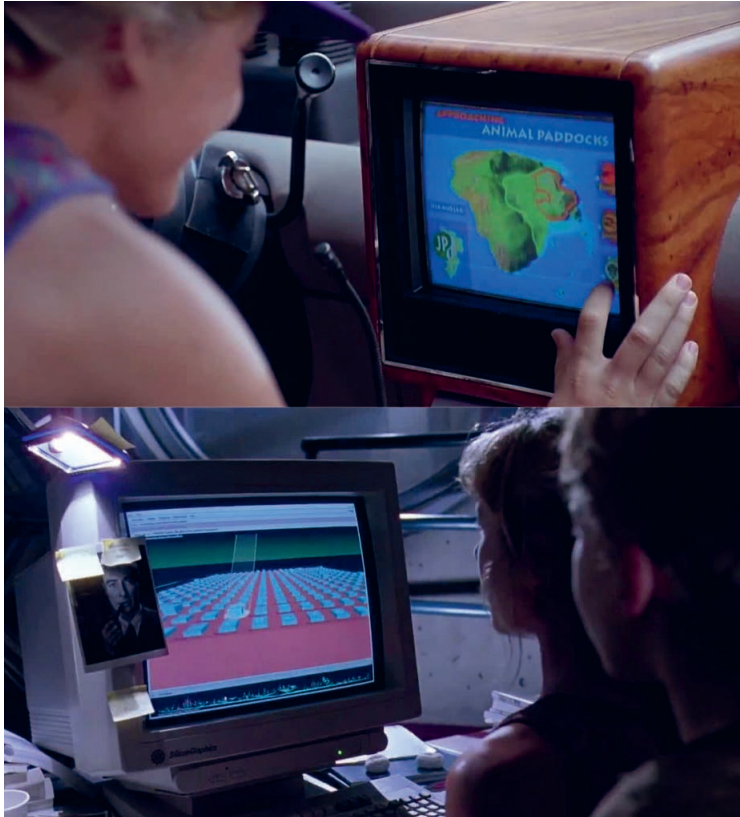
Abb. 1: Interagieren in Jurassic Park.