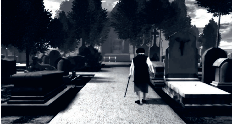
Abb. 4: Gehen in THE GRAVEYARD .

Es geht langsam zu in THE GRAVEYARD . Die Dame geht am Stock. Seitenwege können begangen, aber nicht eingesehen werden, weil unser Blick nur geradeaus gerichtet bleibt – Fluchtpunkt Sitzbank. Der im Game-Zusammenhang so gern verwendete Begriff der „Echtzeit“ erhält hier eine ganz neue Bedeutung; die Bedingungen der alten Dame werden die unseren und werden es doch nicht, weil wir ihr nur auf einem Wege folgen können. Wenige Games führen so deutlich vor Augen, Ohren und Händen, was von Computerspielen (und Interaktion mit Computern) üblicherweise erwartet werden darf, indem diese Erwartungen erfüllt und zugleich gestört werden. Dass dies mit einem Avatar geschieht, deren menschliche Pendant (noch immer) nicht zum Zielpublikum von Firmen wie Activision Blizzard oder Electronic Arts gehören, macht die Frage der Vermittlung, die hier auf mehreren Ebenen ankommt, desto interessanter.