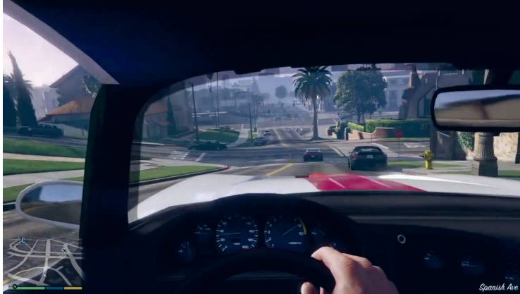
Abb. 3: Fahren in GRAND THEFT AUTO V (Screenshot).

mit Übersetzungsleistungen und vorbereitenden Operationen. Bestimmte Signalübertragungen sind an bestimmte Umgangsformen gekoppelt. Wir realisieren sie im Umgehen mit z. B. Maus, Controller, Touchscreen und operativen Bildern graphischer Interfaces oder durch lesbare/vorgesehene Gesten vor der Kinect-Kamera, damit die angelegte Kombination von Hard- und Software die Umsetzung von „Umblättern“, „Fahren“ oder „Streicheln“ ermöglicht.