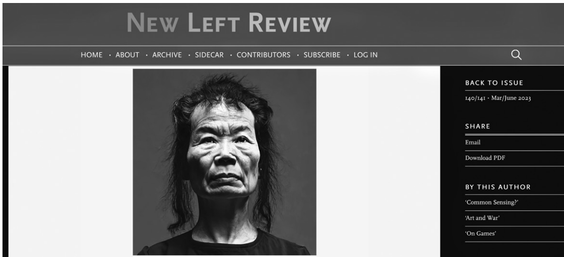
Abb. 1 Mit Stable Diffusion generiertes Bild zum Prompt «Image of Hito Steyerl»

baren Oberfläche dieser Bilder niederschlagen, als «an approximation of how society, through a filter of average internet garbage, sees me». 4