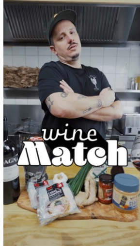
Abb. 2: Format Wine.Macht Food and Wine Pairing auf Instagram.

Standpunkte. Bestes Beispiel: Warum sollen wir den Kloß bei der Gänsekeule denn für das Pairing probieren? Der spielt eine untergeordnete Rolle, das ist ein Medium zur Aufnahme für die Soße. Das Fleisch, die Intensität der Gewürze, das müsste man überprüfen. Bei anderen Komponenten spielt dann eher Süße eine Rolle und dann hast du deine Parameter dafür. Soße spielt eine große Rolle.