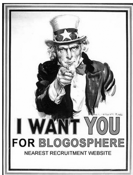
Abb. 1: www.primarilypaul.com

Als visuelle Artikulations- und Verschriftlichungsmedien explizit persönlicher bzw. personalisierter Form zählen Weblogs, kurz: Logs oder Blogs, zu den aktuellsten Aufzeichnungssystemen der digitalen Kultur (Abb. 1)