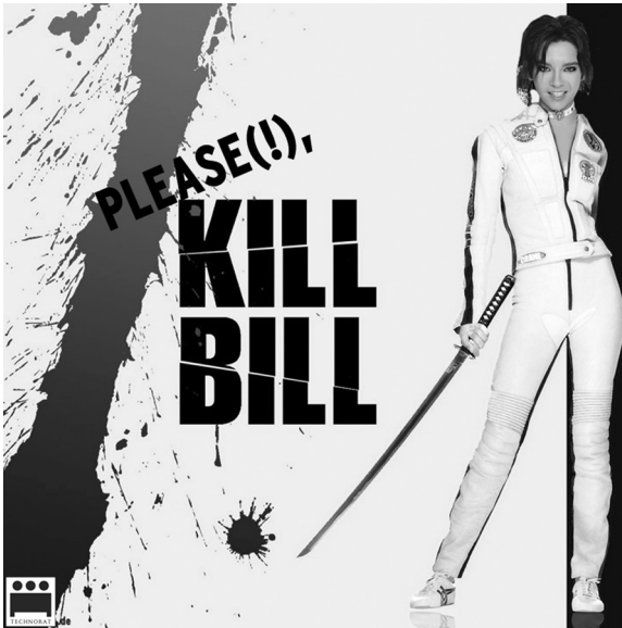
Abb. 4: www.sinn-frei.com/tokio-hotel-bill-ist-ein-maedchen_2424.htm

David Bowie, Iggy Pop u.a.). Diese Kombination aus kulturellem Cross Over, Medien- und Format-Cross Over verbreitet sich sehr schnell über die Weblogs der Fans und illustriert dabei zugleich die vielschichtigen prekären Übergänge zwischen Fakt und Fiktion. Nicht nur in biografischen Narrativen sondern auch in visueller Selbstbeschreibung und –präsentation wechseln die Blogs zwischen den schon genannten Parametern des Protokolls bzw. des Fotorealismus und den hoch dramatisierten Erzählschemata der Mangas. Zugleich überschreiten sie dabei kontinuierlich die Grenzen der eigenen Blogosphäre und gleiten in andere Blogosphären, Szenen und Communities hinüber. 24