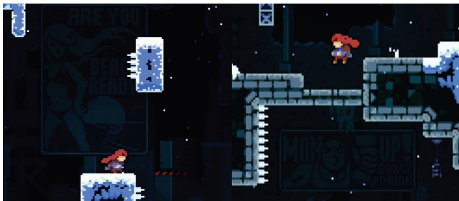
Abbildung 1: Werbeanzeigen als (ironisierende) Botschaften im Hintergrund (EXOK 2018; Screenshot, eigene Aufnahme).

terfragt. Im Hintergrund des Levels werden statische Werbeanzeigen visualisiert, die sich kaum vom Grauton der Umgebung abheben: Hier zeigt sich eine Frau im Bikini neben dem Schriftzug Are You Beach Ready? , bevor ein muskulöser Mann nebst Man Up! Energy Drink erscheint (s. Abb. 1). In Anlehnung an Ruberg können diese als „in-game representations of queerness“ (2018, 2.5) bezeichnet werden, die dazu dienen, die Sehgewohnheiten, Körper- und Rollenverständnisse der Spieler*innen infrage zu stellen.