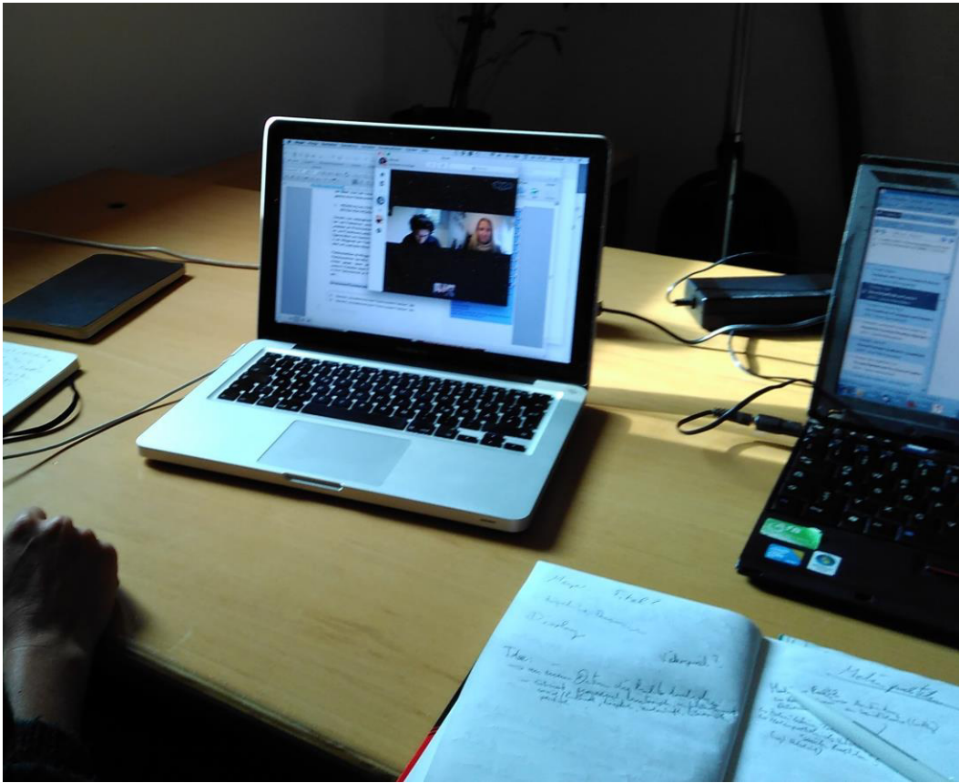
Abb. 3: Fotografie des Arbeitsplatzes

Zwei Computer stehen in dieser Fotografie nebeneinander: es sind die Rechner der beiden gemeinsam an der Konferenz Teilnehmenden, deren Bewegtbild vom linken Rechner erfasst wird. Auch Notizbücher, eine Hand und Verkabelungen sind in diesem Bild zu sehen.