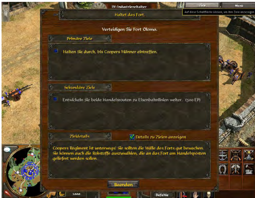
Abb. 6 Aufgaben-Interface von AGE OF EMPIRES III (2005)

ment: »While video games are undoubtedly an extension of what Althusser refers to as ›the cultural ISA‹, they nevertheless also tend to reinforce the work of educational or pedagogical institutions, since – like all ISAs – their primary function is the reproduction of the dominant ideology« (Garite 2003, 8).