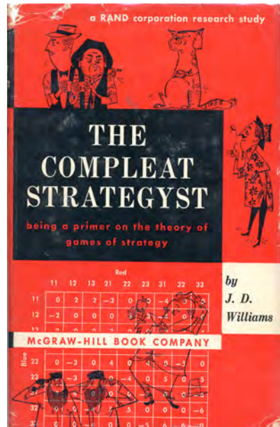
Abb. 5. Populäre Publikation der RAND-Corporation zur Spieltheorie von 1954

Eine solche Perspektivierung lässt erkennbar werden, auf welche Art und Weise ein Strategiespiel als Kulturtechnik begriffen werden kann. Es ist nicht das in der Spielhandlung oder Spiel-Narration verhandelte Prinzip, sondern vielmehr