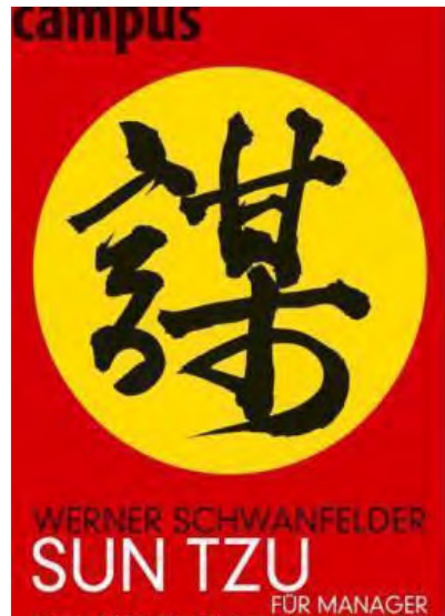
Abb. 2: Werner Schwanfelder (2004): Sun Tzu für Manager: Die 13 ewigen Gebote der Strategie .