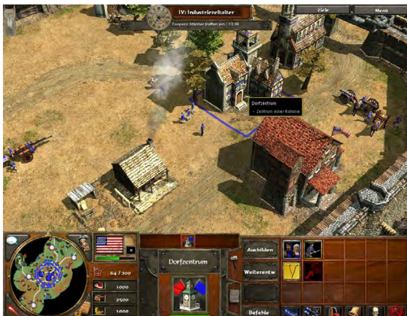
Abb. 3 Interface von AGE OF EMPIRES III (2005)

Strategiespiels ist aber nur möglich, wenn dem Spielenden eine Balance zwischen dem Blick auf das Detail und dem globalen Überblick gelingt: archetypisch für diese verteilte Aufmerksamkeit und multi-tasking ist die Doppelung des kartographischen Raums im Spielinterface (s. Abb. 3), die zumeist durch die Co-Präsenz von Spielraum als Handlungskarte im Hauptbildschirm und der gleichzeitigen Darstellung der Überblickskarte im Interface (der so genannten ›mini map‹) hergestellt wird (vgl. Wiemer 2008b, 230ff.).