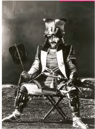
Abb. 1: Strategie und Taktik in Akira Kurosawas KAGEMUSHA – DER SCHATTEN DES KRIEGERS (J 1980). Ein Doppelgänger, der eigentlich Taschendieb ist, kann die Rolle des Feldherren einnehmen. Schon die Präsenz des Doubles lässt die Soldaten Mut gewinnen.

Die Kriegswissenschaft definiert den Strategen als Feldherrn, der Krieger und Politiker in einem ist. Sein Handeln orientiert sich an einem übergeordneten Meta-Rahmen (der langfristigen Erreichung von politischen Zielen) und definiert untergeordnete, nicht von ihm ausgeführte konkrete Mikrohandlungen (zeitkritisch zu fällende Einzel-Entscheidungen auf dem Schlachtfeld). Damit nimmt der Strategie – zumindest in diesem einfachen Bild – eine ambivalente, wenn nicht gar passiv zu nennende Rolle ein: er ist dem Kalkül eines höheren Prinzips unterworfen (dem Politischen) und unfähig, das sich tatsächlich vor seinen Augen entfaltende Szenario der Schlacht konkret zu beeinflussen. Er legt einen grundsätzlichen und zielorientierten Rahmen zu Erreichung eines militärischen Zieles fest, er befiehlt die Einheiten, er gruppiert und reorganisiert, gibt Befehle und nimmt diese zurück. Das letztendlich agierende Glied in der Schlacht, das kämpfende Subjekt, entzieht sich jedoch ei-