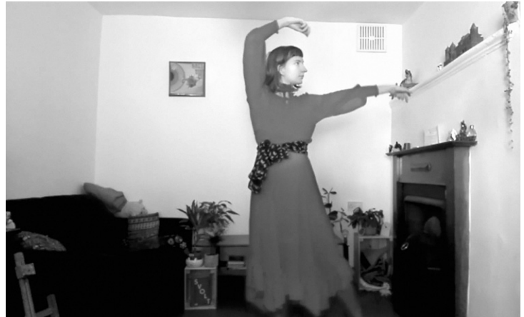
Abb. 6 Fanvideo des Most Wuthering Heights Day Ever , Dublin 2020

Interessanterweise hat sich auch Kate Bush in den 1990er Jahren für die Produktion ihres Studioalbums The Red Shoes und des dazugehörigen Musikfilms The Line, the Cross and the Curve mit dem Thema <Tanzwahn> befasst. 38 Die Inspiration dafür ging auf den berühmten Tanzfilm The Red Shoes von Michael Powell und Emeric Pressburger zurück, 39 der wiederum ein Märchen von Hans Christian Andersen adaptiert. 40 Gegenüber dem Melody Maker erklärte Bush 1993 ihr Interesse an dem Stoff wie folgt: