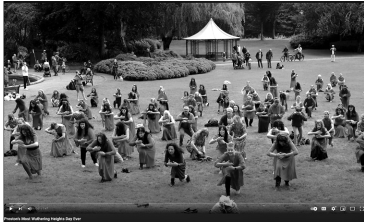
Abb. 7 Flashmob vom Most Wuthering Heights Day Ever , Preston, USA 2023

Was beim Most Wuthering Heights Day Ever als spielerische Aneignung erscheint, lässt sich als eine zeitgenössische Form kollektiver Ekstase verstehen, in der der kontrollierten Entgrenzung ein eigener sozialer und ästhetischer Wert zukommt. Die synchronisierten Körper produzieren ein kollektives Affektfeld, das gerade in der Verbindung von Digitalität und Körperlichkeit eine spezifische Form der communitas darstellt, die sich durch drei miteinander verschränkte Dimensionen auszeichnet: erstens durch eine oszillierende Bewegung zwischen digitalen und physischen Räumen, zwischen medialer Repräsentation und körperlicher Aufführung, wobei die Verkörperung nicht als Endpunkt, sondern als Durchgangsstadium eines zirkulären Mediationsprozesses zu verstehen ist; zweitens durch eine affektive Dimension des Ergriffen-Werdens, die in kollektiven