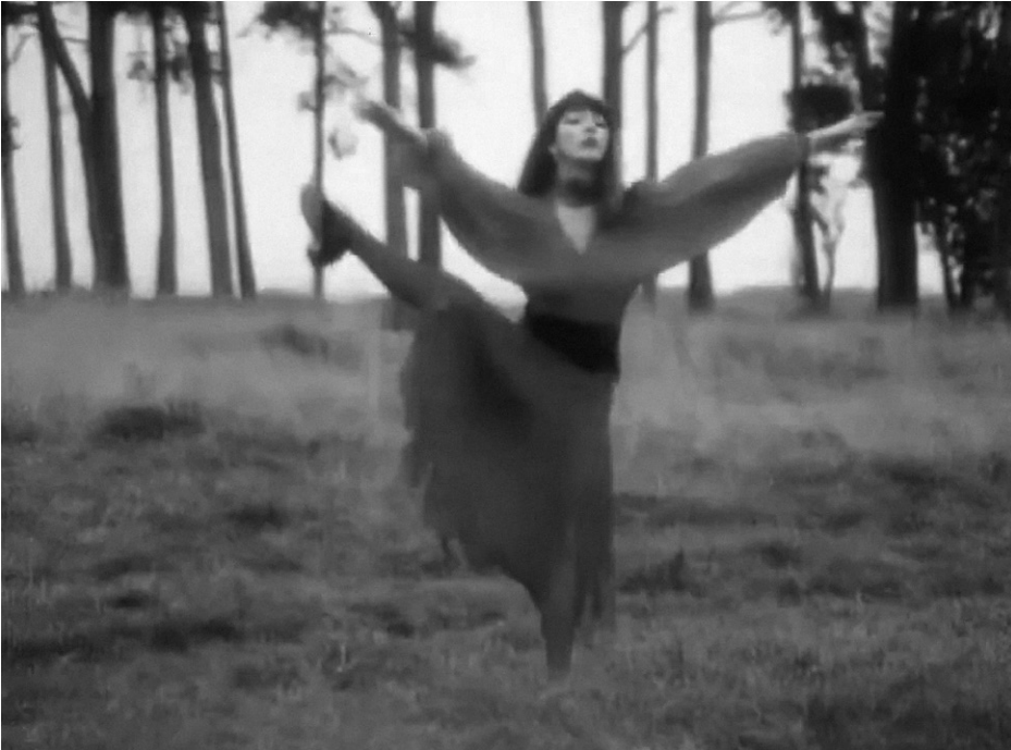
Abb. 1 Kate Bushs Tanzbewegungen aus dem Wuthering-Heights -Musikvideo

5 Vgl. z. B. den Kommentar von @slightlyoffendedcockatoo am 24.7.2024 unter dem Video von @FMLocalHistory zum Most Wuthering Heights Day Ever im Fairview Park (Dublin) am 30.7.2022, TikTok, 24.7.2024, tiktok.com/@fmlocalhistory/video/7123905049591319814 (28.2.2025).