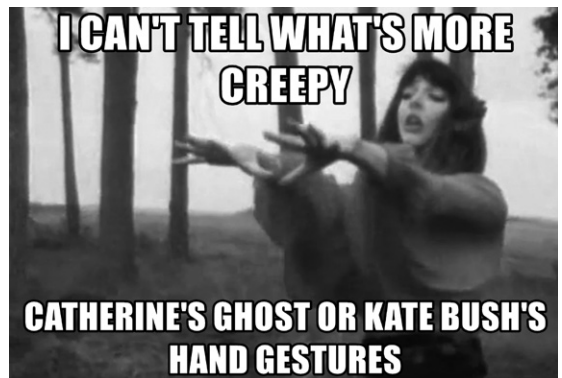
Abb. 2 Meme zu Kate Bushs Wuthering-Heights -Musikvideo-Tanzbewegungen

1978 gab Kate Bush mit dem Lied «Wuthering Heights» ihr Debüt in der ersten Ausgabe von Bio's Bahnhof , einer damals neuartigen Musikshow im deutschen Fernsehen. 12 Ich meine, diesen Auftritt zusammen mit meiner älteren Schwester gesehen zu haben. Eine wundersame Gestalt in einem roten Flatterkleid tanzte da vor dem düsteren Gemälde einer Landschaft mit ausbrechendem Vulkan. Bush schien direkt der Verkleidungskiste in unserem Kinderzimmer entstiegen zu sein, als sei sie eine von uns und doch ganz fremdartig. Meine Schwester trat sofort in eine neue juvenile Stilphase ein und färbte alles weinrot: ihre Kleider, ihre langen Haare, die Kissen und Decken auf der Matratze in ihrem Zimmer, in dem bald darauf auch das mit roten Chinoiserien verzierte Cover von Bushs Album The Kick Inside an der Wand hing. Die LP lief rauf und runter. Englisch verstand ich damals noch nicht, aber ich wusste, dass es in «Wuthering Heights» um eine Geistergeschichte geht, was mich sehr faszinierte. Den Roman von Emily Brontë, auf den das Lied sich bezieht – auf Deutsch Die Sturmböhe –, bekam ich ein paar Jahre später zu Weihnachten geschenkt und verschlang ihn in wenigen Tagen.