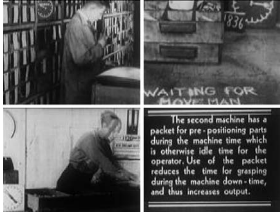
Anwendung auf andere Industriebranchen: Rationalisierung von Verpackung und Versand, dargestellt in einem amerikanischen Film über Frank B. Gilbreth aus dem Jahr 1948.

Dabei stellt sich allerdings ein spezifisches Wahrnehmungsproblem. Die Unterschiede zwischen den alten und den neuen Arbeitsroutinen erscheinen mini-