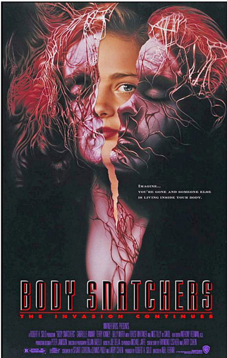
Poster design by B.D. Fox Independent