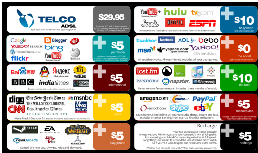
Abb. 1. Infografik zur Netzneutralität

Spezialdienste galten. Ob etwa Google nun ‚für‘ oder ‚gegen‘ Netzneutralität argumentiert, wurde und wird misstrauisch beäugt.