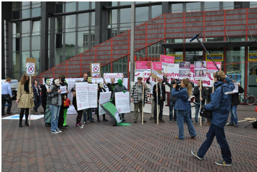
Abb. 4. Flickr-Stream von netzpolitik.org, 16.05.2013.