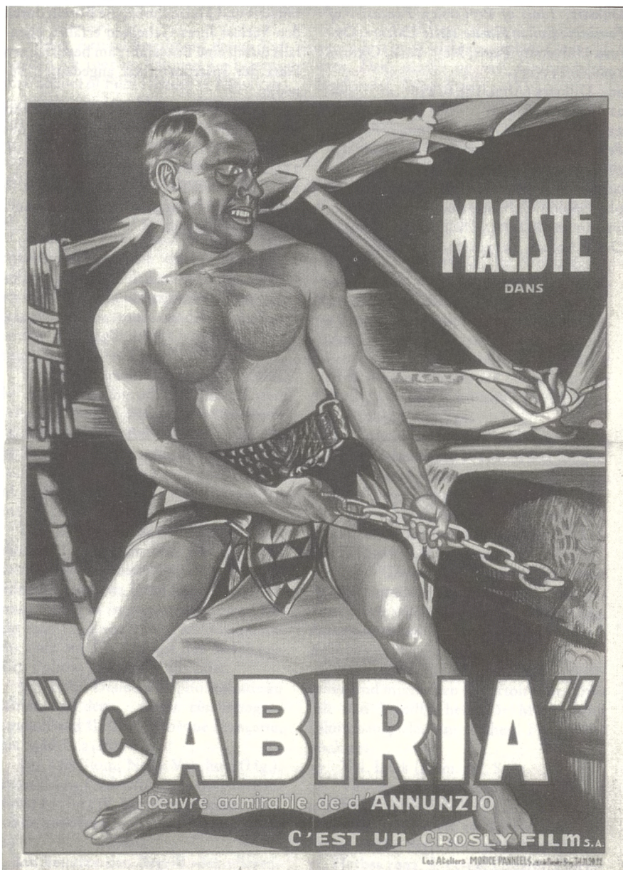
Plakat des belgischen Verleihs Crosly (Coll. Museo Nazionale del Cinema, Turin).