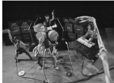
Abb. 1: Videostill Hell Hole , Spinal Tap in Miniatur

Dieses Video ist eines der vielen Details, aus dem sich das Universum der fiktiven Band Spinal Tap speist, die seit ihrer filmischen ›Erfindung‹ ein erstaunliches Nachleben führt. Zu diesem Universum gehört nicht nur der Film selbst, die darin zu findenden Rekonstruktionen der Bandbiografie (wie alte Aufnahmen von Fernsehshows aus den 1960er Jahren, fiktive, liebevoll gemachte Plattencover) oder das Bonusmaterial auf der DVD (wie Werbeclips, 1 Videos und Talk-Show-Auftritte), das Soundtrackalbum im schwarzen Cover, sondern auch Konzerttourneen, das ›reguläre‹ Album BREAK LIKE THE WIND von 1992, Auftritte bei den SIMPSONS 2 und dem Live Earth Konzert von 2008, einer Vielzahl liebevoll gemachter Merchandising-Produkte 3 sowie etliche Auftritte der Schauspieler ›in character‹ in weiteren Talk-Shows 4 oder in Zeitschriften. 5 Dieser Beitrag wird sich den Film und das Universum der fiktiven Band genauer anschauen, um zu bestimmen, was er als Parodie von Heavy Metal über Heavy Metal zu sagen hat und welches Wissen über oder Bild von Heavy Metal dadurch entsteht. Eine der Thesen des Beitrags lautet, dass es kein Zufall ist,