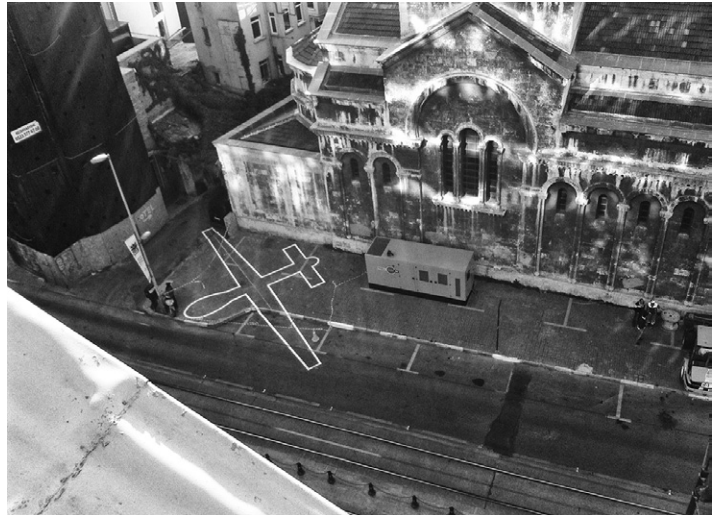
Abb. 2 Der Künstler James Bridle markiert die Umrisse von Drohnen im Maßstab 1:1 im öffentlichen Raum. Ansicht von Drone Shadow 002 , Installation, Istanbul 2012