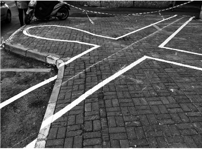
Abb. 3 James Bridle, Drone Shadow 002 , Installation, Istanbul 2012

des Wissens: Der Chirurg kann etwa meine Schulter genau kennen und dabei kaum Kenntnisse anderer Aspekte meiner Person benötigen. Bei ferngesteuerter Tötung hingegen beruht der Unterschied zwischen Mord und einer auf Basis der Einsatzregeln legitimen Aktion nicht auf dem Erkennen von Körpern, sondern (zumindest grundsätzlich) von Personen. Und hier entstehen die Probleme. Bei einer Präsentation im Rahmen eines Symposiums der US Army und des Marine Corps Counterinsurgency Center im Jahr 2010 räumt ein Militärberater ein,