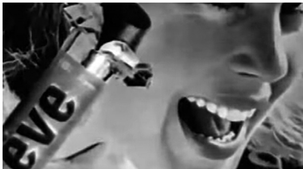
2-4 Ein Muster in den Fotografien des militanten Kinos