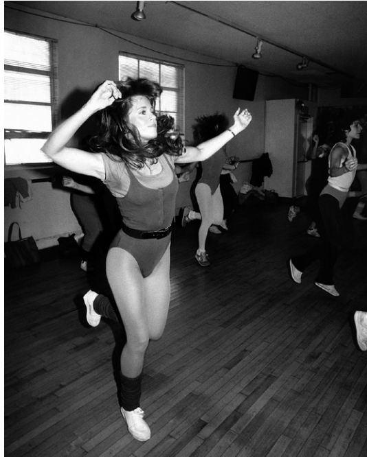
5 «Weibliche Resilienz»: Jane Fonda als Aerobic-Ikone der 1980er-Jahre

Ich schlage vor, auf die Aerobic-Pionierin zu fokussieren, die Fondas Star-Image, über das der politischen Aktivistin der 1960er- und 1970er-Jahre hinaus, um eine weitere Diskursivierungsebene bereichert hat.