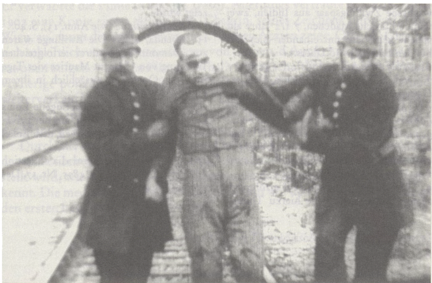
LIFE OF CHARLES PEACE: »Struggle in the Railway Carriage«.