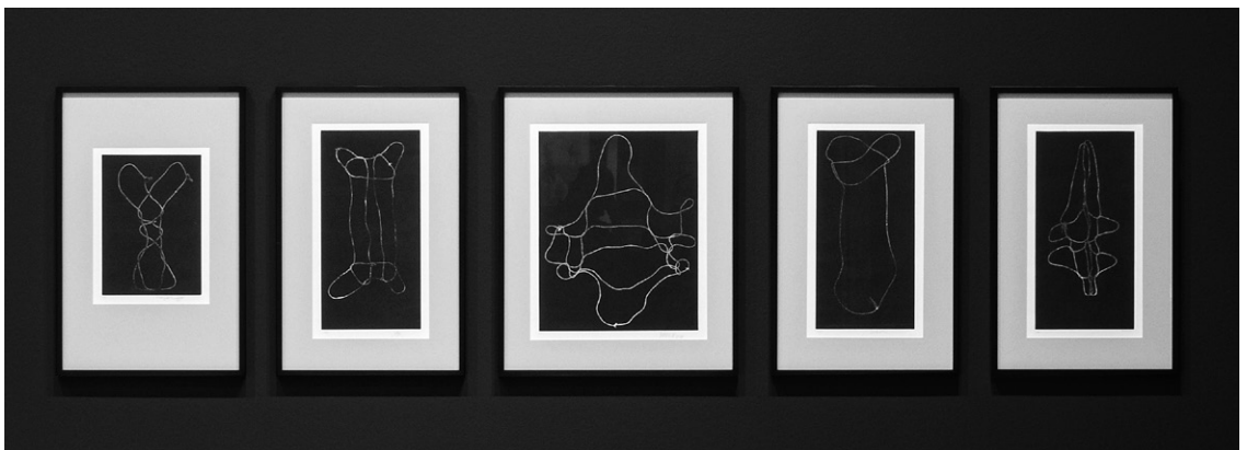
Abb. 2 Fadenspieldrucke des Buku-Larrnggay Mulka Art Centre Yirrkala, 2019