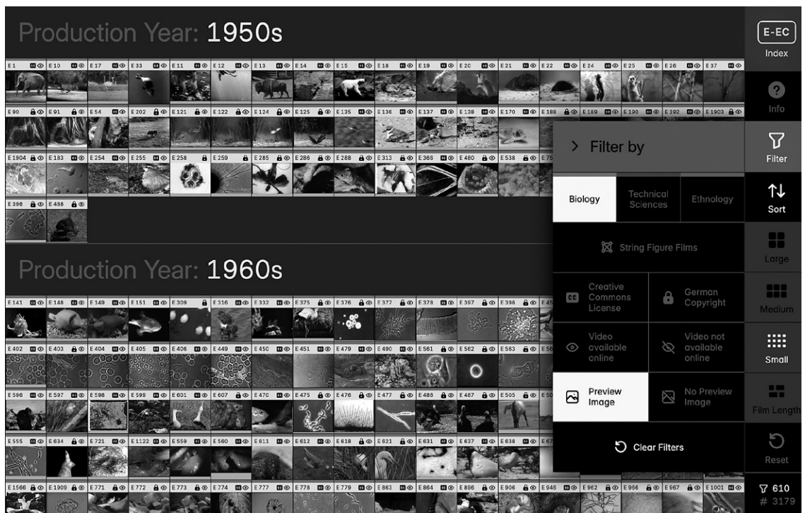
Abb. 4 Detailsicht des Interfaces E-EC Index zur Gegenwart der Sammlung