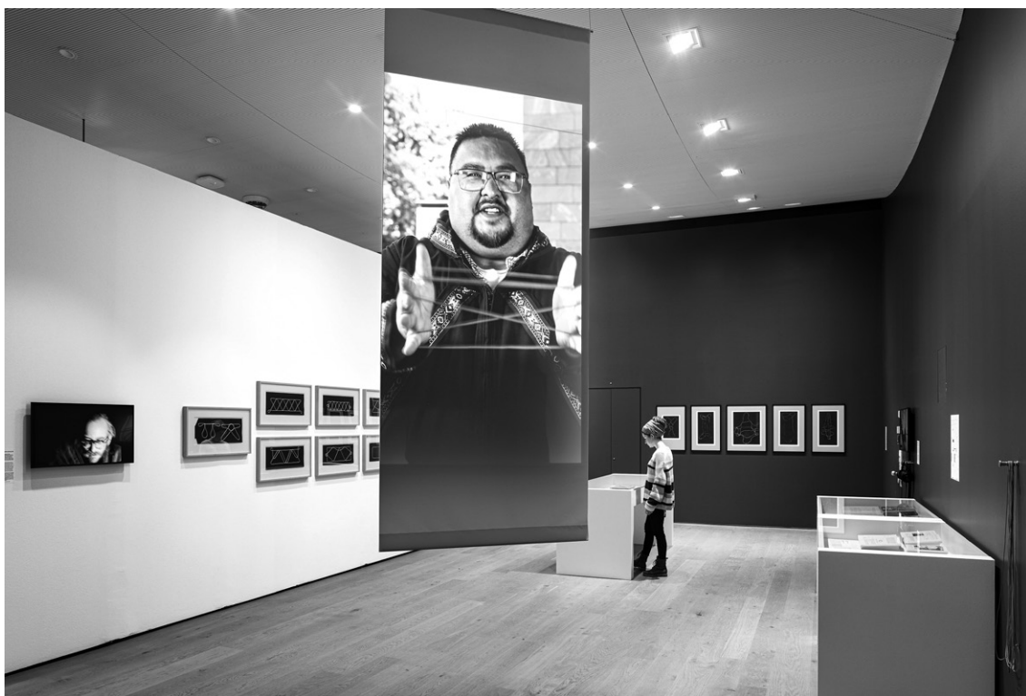
Abb. 1 Ausstellungsansicht des ersten Raums von Fadenspiele. Eine forschende Ausstellung