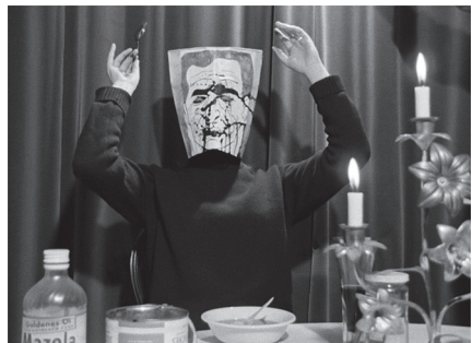
1–6 Filmstills aus Harun Farocki, DIE WORTE DES VORSITZENDEN, 1967

Man nahm damals, was gerade passte? Gab es kein Bedürfnis nach spezifischen Lektüren?