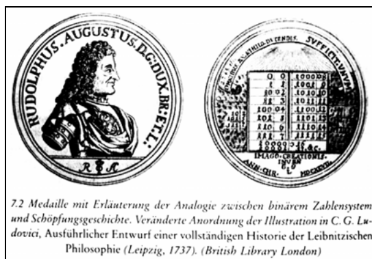
Abb. 1: Medaille, aus: Aiton: Leibniz (Anm. 21), S. 302

werden kann. Der erhaltene Entwurf einer Medaille aus dem Jahre 1697 zeigt eine „Tabelle der binären Zahlen mit ihren Äquivalenten im Zehnersystem“ samt Beispielen für „binäre Addition und Multiplikation“. 27