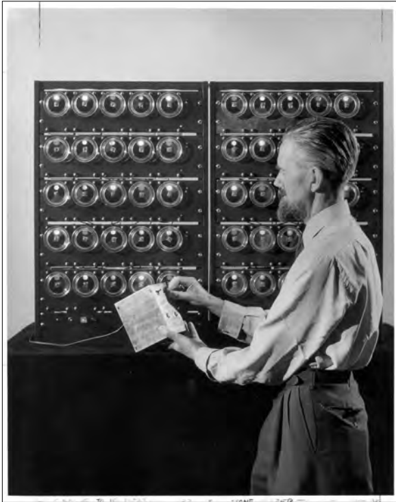
2 – Ross Ashby am Biological Computer Laboratory mit seiner ‚Ashby Box‘“

es in der kybernetischen Forschungspraxis der frühen 1960er nicht um die verlässliche Delegation von Redundanzen und Routinen an sklavenhafte Apparate, sondern um die Produktion von Emergenzen und Unvorhersagbarkeiten mithilfe einer Maschinengattung, die man als ‚lebhaft Artefakte‘ bezeichnen kann. 54 Ein kurzer Blick auf zwei Vertreter dieser ‚Neuen Lebhaftigkeit‘ lässt erahnen, warum diese Maschinen mit den Vorstellungen der Cybernation gänzlich kaum vereinbar waren.