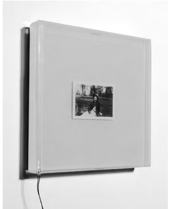
Abb. 3 Jim Campbell, Photo of My Mother , 1996, 180 × 38 × 15 cm, elektronische Geräte, Glas, Fotografie, LCD-Material

Das Konzept des ästhetischen Mediums wird häufig bis zu Lessing zurückverfolgt, der in seinem Laokoon (1766) gegen die Vertreter der horazischen Doktrin des ut pictura poesis für das je «Eigene» der Malerei und der Dichtung stritt. Die Zeichen eines jeden Mediums müssen Lessing zufolge zu den Gegenständen passen, die sie bezeichnen, und schreiben somit die Relation zu Zeit und Raum vor. Da die Malerei mit Figuren und Farben operiert, die gleichzeitig nebeneinander bestehen, während die Dichtung ihre Elemente nacheinander anordnet, setzt Lessing die Malerei mit dem Raum (Simultaneität) und die Dichtung mit der Zeit (Sukzessivität) gleich. Die Materialität eines Mediums