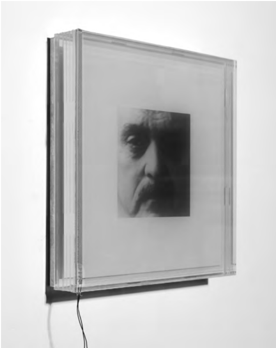
Abb. 2 Jim Campbell, Portrait of My Father , 1994–95, 180 × 38 × 15 cm, elektronische Geräte, Glas, Fotografie, LCD-Material

Geschlechterdifferenz durchzieht als Unterscheidung zwischen dem Analogen (der Kontinuität, dem Verbindenden, der Homogenität des Atems) und dem Digitalen (der Diskontinuität, dem binären An-Aus des Herzschlags) die Arbeiten. Die Mutter ist – selbstverständlich – aufseiten des Analogen, mit kontinuierlicher, wenngleich modifizierter Präsenz, der Atem besänftigend fließend, ohne Unterbrechung, ohne Mangel. Der Vater ist aufseiten des Digitalen, vergleichbar der An- und Abwesenheit des Herzschlags, dem Ursprung des Gegensatzes von Diastole und Systole, als gesetzgebende Kraft. Er nimmt eine steife, förmliche Pose ein; sein Gesicht ist nahe gerückt und füllt (ohne mise en scène ) den Bildrahmen aus, Kamera und Betrachter gleichermaßen konfrontierend – das ist das Portrait of My Father . Die Mutter hingegen ist entspannt und strahlt Spontaneität aus, sie befindet sich auf dem Land, inmitten einer bukolischen mise en scène . Hier ist eine Zufälligkeit aufgerufen, wie sie der Amateurfotografie zugeschrieben wird, ohne dass die