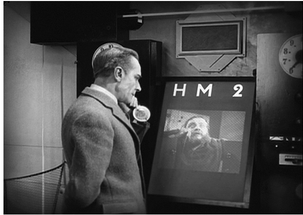
Fernsehen als Bildtelefon in Fitz Langs METROPOLIS

eine Telepräsenz (denn es verlängere den menschlichen Aktionsradius, ermögliche ferngelenkte Bomben und werde vom Reichsluftfahrtministerium installiert und ausgebaut). Diese und andere Vorstellungen – und ebenso ihre jeweiligen Advokaten – lagen im Wettstreit miteinander. Heute halten wir eine be-