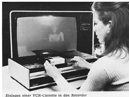
Einlegen einer VCR-Cassette in den Recorder

Angesichts dieser Situation in der bundesrepublikanischen Fernsehgeschichtsforschung muten viele Forschungsreisen ins Ausland wie eine Begegnung mit Utopia an. Amerikanische Rundfunkmuseen wie etwa in New York bieten einen unbegrenzten und meist kostenfreien Zugang zu ihrem Archivmaterial, das vor Ort in eigenen Räumen visioniert werden kann. Auch Unterhaltungssendungen haben dort die Zeiten überdauert und werden als Produkte mit