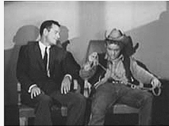
James Dean and Gig Young

James Dean in an ironic PSA (public service announcement) for driving safety with Gig Young. A disinterested Dean tells young kids to drive safely and that the life you might save, could be his.