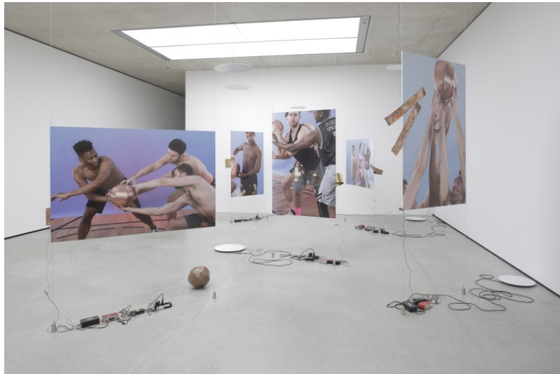
Ausstellungsansicht Kunst-Musik-Tanz. Staging the Derra de Moroda Archives