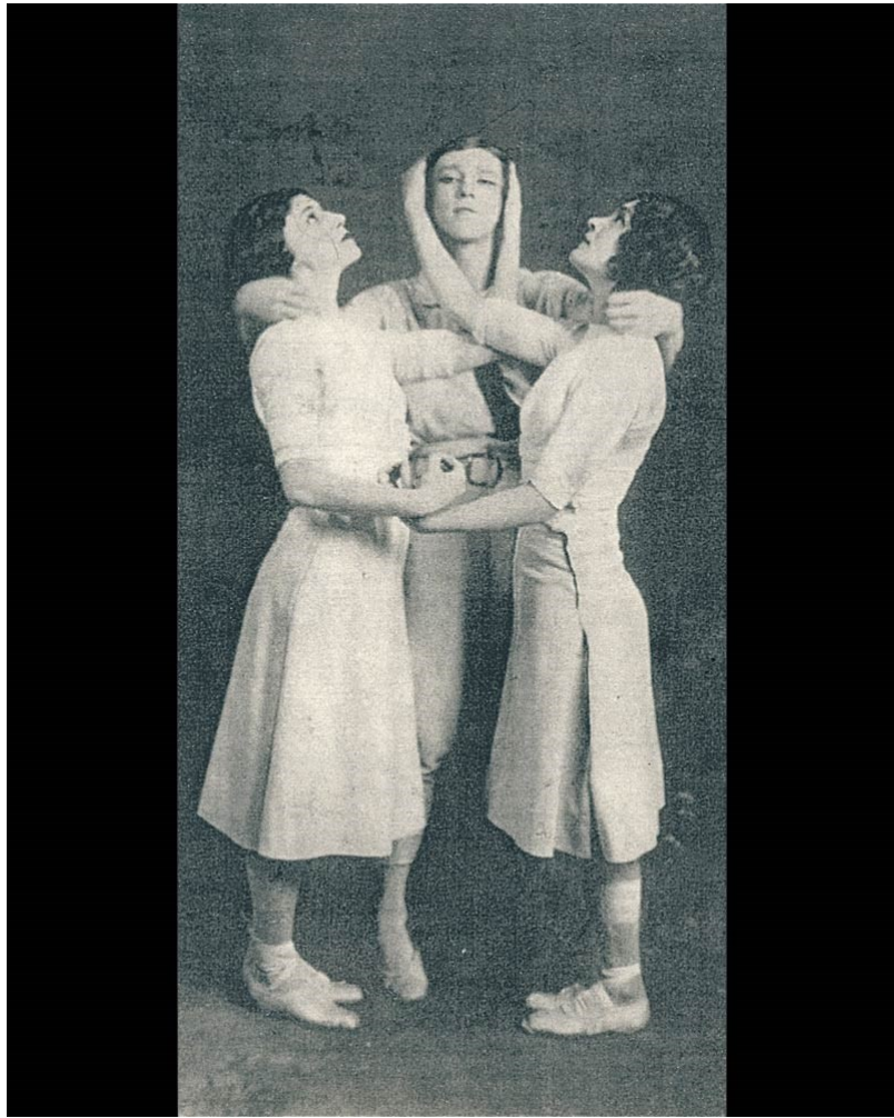
Abb.: Szenenbilder aus Jeux .