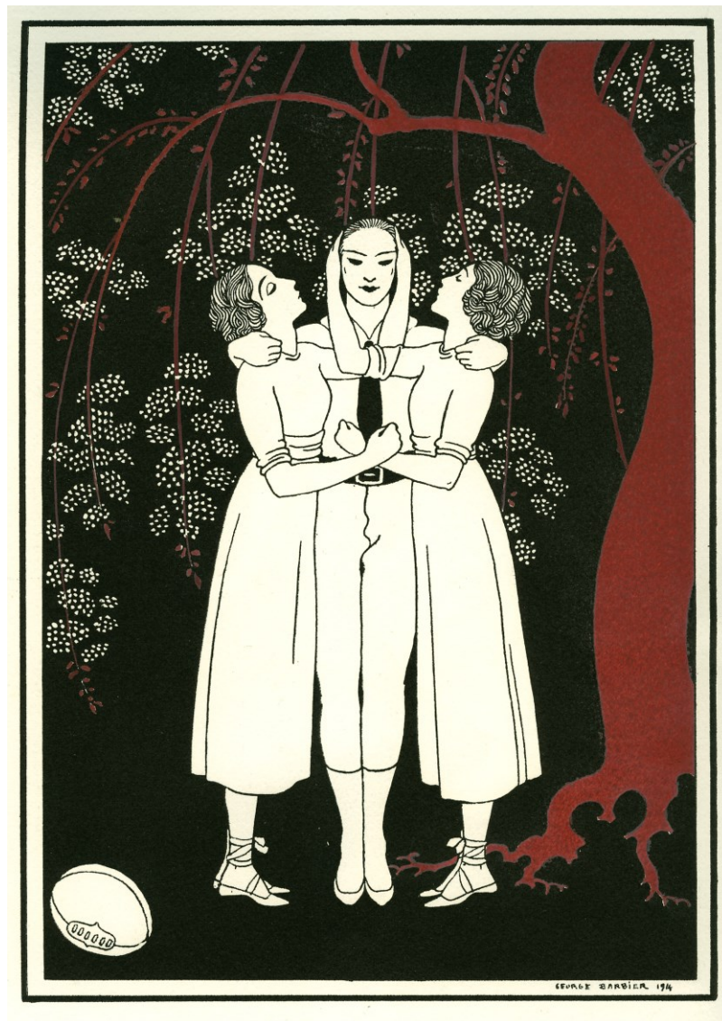
Abb. 2: Antoine Barbier: Szene aus Jeux . Pochoir Druck, 1914.

Bestand Derra de Moroda Dance Archives Salzburg, Signatur DdM ic M 001_08