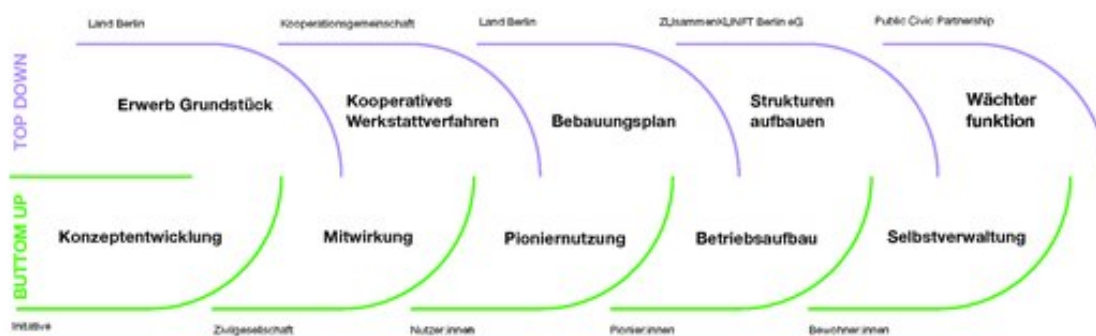
Abb 2. Verzahnung Top Down und Bottom Up Ansätze zu jeder Phase des Projekts.

Im Zuge der Entwicklung der Pioniernutzungen im Haus der Statistik gilt es stets, auch grundlegende Fragen der Teilhabe zu verhandeln: Wie kann sich einerseits eine Gemeinschaft innerhalb der Pioniernutzer:innen bilden und andererseits die breite Stadtgesellschaft in den Prozess der Pioniernutzungen kontinuierlich einbezogen werden? Die Möglichkeit der Teilhabe an der komplexen Quartierentwicklung ist maßgeblich abhängig von einer gelingenden Verzahnung der einzelnen Bausteine, Akteur:innen und Prozesse.