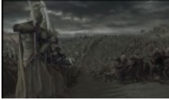
Die Kombination aus Computer- und Real-Aufnahmen

Auch bei den Hobbits war der Griff in die Trickkiste notwendig, um die Größenverhältnisse Mittelerde einzuhalten. Denn Peter Jackson wollte nicht auf kleinwüchsige Darsteller zurückgreifen. Hierzu bediente er sich des Verfahrens der "forced perspective", baute verschieden große Sets oder arbeitete mit Bodydoubeln.