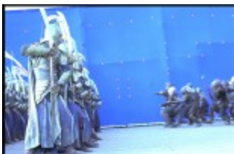
Der Vordergrund wurde mit echten Darstellern gedreht

Die Special Effects im Herr der Ringe wurden nicht um ihrer selbst willen gemacht, sondern weil eine Umsetzung der Welt Tolkiens mit all seinen fantastischen Gestalten, Orten und Gegebenheiten ohne diese nicht möglich wäre. Um nicht von der eigentlichen Geschichte abzulenken, sollte deren Einsatz aber eher unscheinbar gehalten werden. Dennoch fällt er gleich zu Beginn bei der imposanten und bildgewaltigen Massenschlacht zwischen dem Dunkeln Herrscher und seinen Horden und dem Aufgebot der Menschen und Elben auf. Mit Hilfe des AI-Schlachten-Simulationsprogrammes Massive wurden Tausende von Kriegerern jeder Rasse künstlich kreiert, die individuell gesteuert auf gegebene Situationen reagieren konnten. Lediglich die vordersten Reihen bestanden aus Statisten, der Rest des Heeres und die Umgebung ergänzt der Computer.