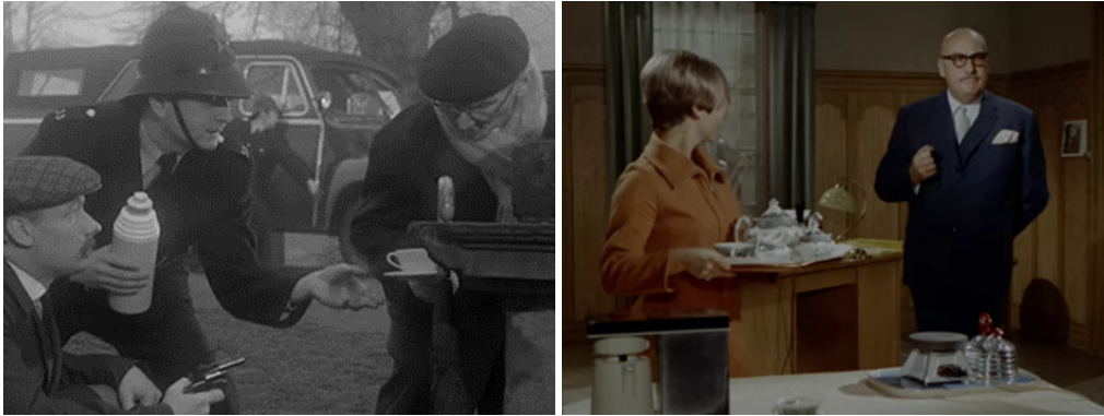
Abb. 5: Tee während des Gefechts ( DER GRÜNE BOGENSCHÜTZE : 01:21:02) und Abb. 6: Tee für Sir John ( DER HUND VON BLACKWOOD CASTLE : 00:29:08).

auch sogleich Tee mit Rum angeboten. Und wenn es nicht gerade Tee ist, ist es Whiskey. Dieser wird entweder im privaten Raum genossen oder in diversen Pubs, Bars und Gasthäusern. Letztere ziehen nicht unbedingt die Upper class an, sondern vielmehr die Working classes .