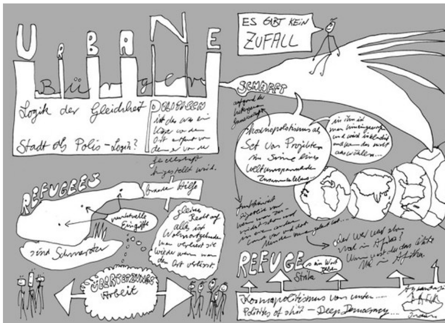
Abb. 1: Städtische Teilhabe und Bürger:innenschaft, Erik Göngrich, 2015[3]