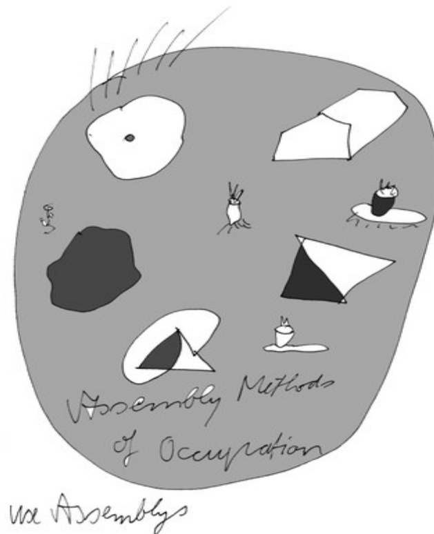
Abb. 11: Versammlung, Erik Göngrich, 2021

werden, zusammenkommen. Die Demonstration Never Mind the Papers bot einen solchen Raum für diejenigen, Geflüchtete und Neuankommende, die ohne akzeptierte Staatsbürger:innenschaft üblicherweise keine Stimme haben und von den gesellschaftlichen Grundrechten ausgeschlossen sind. Mit der Demonstration, der Aneignung des urbanen Raums durch eine große Gruppe von Menschen, die mitten in der Hamburger Einkaufsmeile mit Plakaten, Transparenten und lauten Stimmen ihre Forderungen auf Rechte öffentlich machte, stellte sich ein – zumindest temporäres – Gefühl von Gemeinschaft her. Durch den Akt der Demonstration manifestierten sich die Teilnehmer:innen kollektiv im Stadtraum, machten die Straßen zu einer für alle sichtbaren Bühne für ihre Forderungen und „verwandeln [sie] in temporäre Orte städtischer Bürger:innenschaft“ [Lanz 2015: 489].