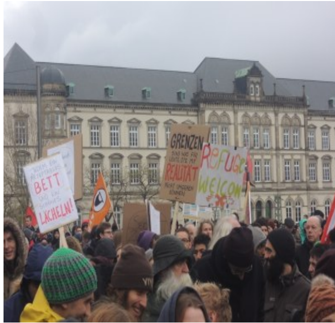
Abb. 9 und 10: Plakate auf dem Demonstrationzug, Kathrin Wildner, 2015