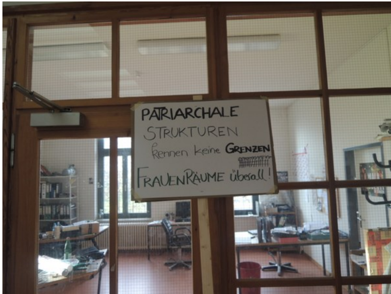
Abb. 7: Plakataktion, Schule für städtisches Handeln, Kathrin Wildner, 2015

In einem weiteren Schritt wurden die Tafeln im Garten und auf den Straßen rund um den Workshop-Ort, ein Kulturzentrum in Wilhelmsburg am Stadtrand Hamburgs, getestet. In dieser Situation entstand zunächst Unbehagen: Was will ich sagen? Was passiert, wenn ich meine Protesttafel, einen Slogan, als Statement in den öffentlichen Raum trage? Wie sichtbar oder angreifbar bin ich?, dann eine zunehmend kontroverse Diskussion über die Frage, wie die metroZones Schule an der Demonstration am nächsten Tag teilnehmen könnte und sollte. Insbesondere wurde die Bedeutung der Intervention diskutiert: Welche Art Slogans könnte man erfinden, welche Botschaft würde man sich aneignen? Und vor allem: Wäre es nicht eine unlautere Aneignung oder gar ein Missbrauch der Flüchtlingssache, im Rahmen der metroZones Schule eine Intervention der Demonstration zu unternehmen?