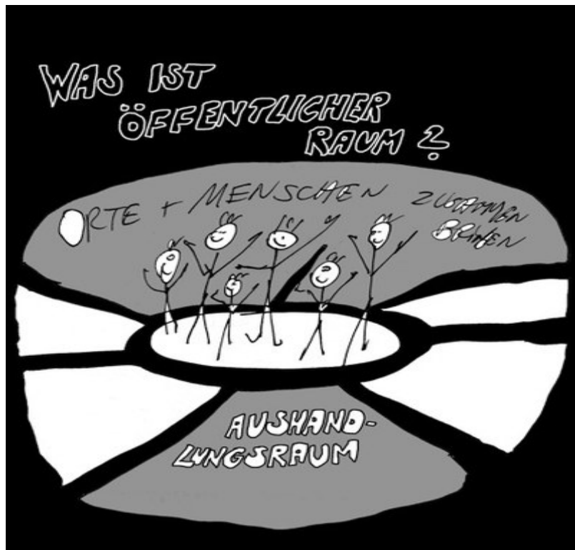
Abb. 3: Öffentlicher Raum, Erik Göngrich, 2016

Im Workshop der metroZones Schule wurden zunächst anhand theoretischer Inputs die gesellschaftlichen Bedingungen der Produktion von urbanem Raum betrachtet [Lefebvre 1991], vor allem aber die Diskussion über und im öffentlichen Raum selbst als ein Aushandlungsprozess zwischen widersprüchlichen Positionen analysiert [Delgado 1999; Wildner 2003]. In den Diskussionen wurden Demonstrationen als ein bewährtes Mittel der politischen Intervention beschrieben, bei der die Zivilgesellschaft Kollektivität auf der Straße praktiziert und Dissens sichtbar gemacht wird.