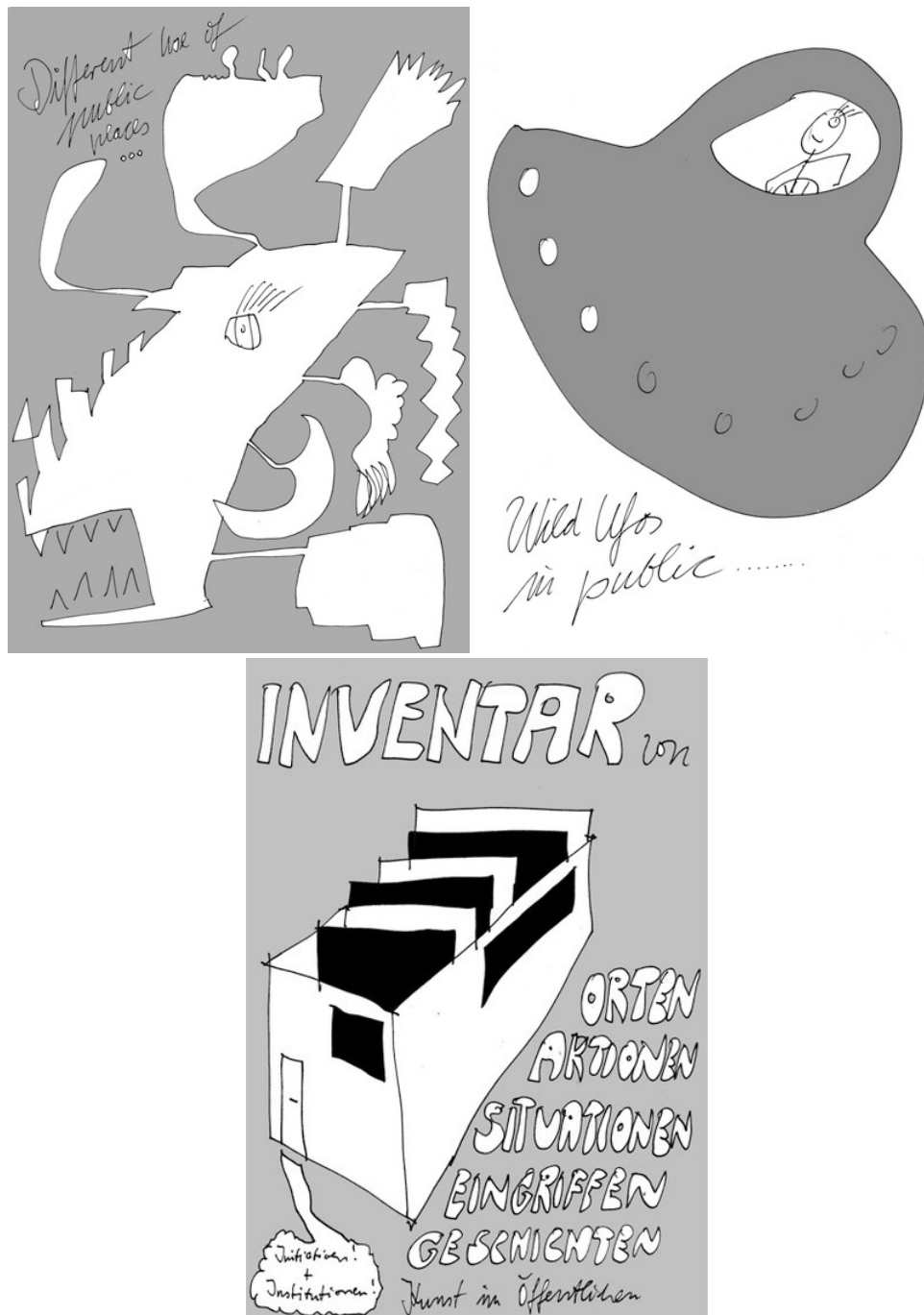
Abb. 4 – 6: Interventionen im öffentlichen Raum, Erik Göngrich, 2015

Neben der Diskussion theoretischer Konzepte lag ein Hauptaugenmerk dieser Schuleinheit auf der Identifizierung und Beschreibung von Instrumenten und Praktiken, die Sichtbarkeit im öffentlichen Raum erzeugen können. Die urbane Praxis des Demonstrierens, damit auch die konkrete Demonstration Never Mind the Papers am kommenden Tag, schien ein perfekter Moment zu sein, um Aspekte städtischen Handelns zu diskutieren und zu erproben.