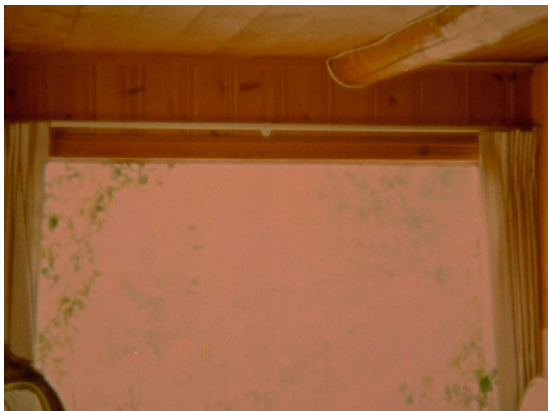
2-4 STAR GARDEN (Stan Brakhage, USA 1974).