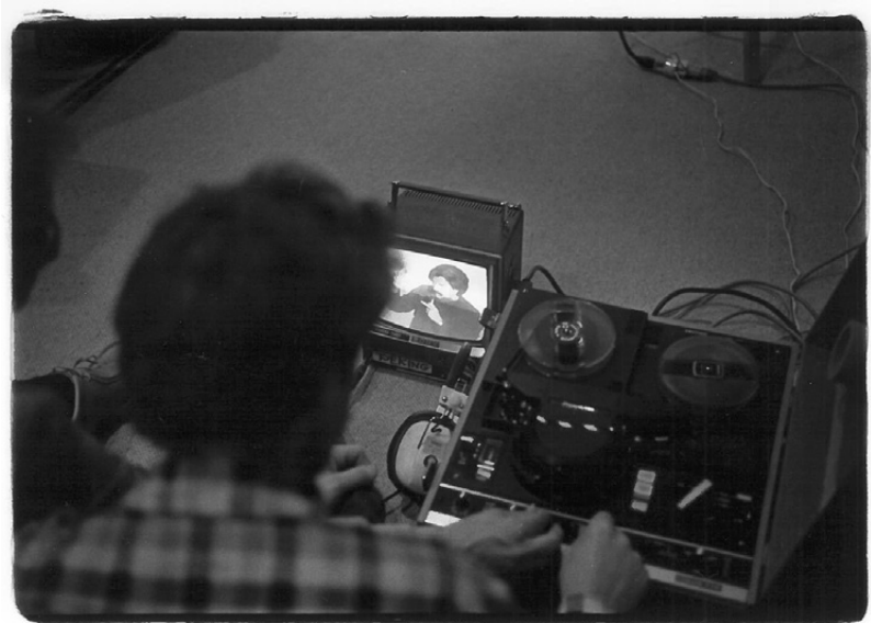
5–6 Premiere von THE TEXT OF LIGHT (Stan Brakhage, USA 1974), Carnegie Institute, Pittsburgh, 26. Oktober 1974.