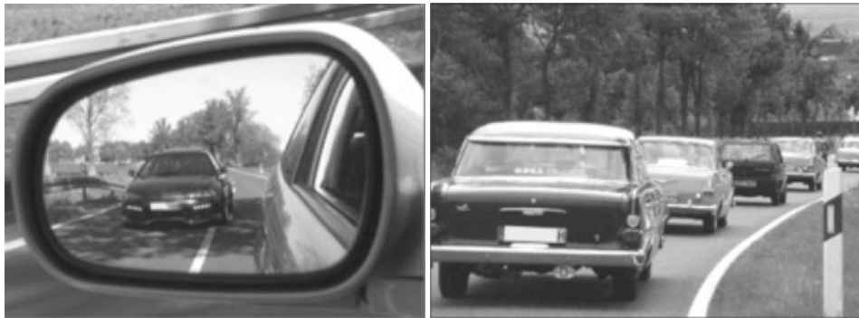
Abb. 4: Typische Praktiken von Anhängern modifizierter (Bild links) und originaler PKW (Bild rechts) 11

Automobils wird durch die Maskierung der Scheinwerfer an den Innenseiten erzielt, so dass die ›Augen‹ des Autos für vorausfahrende Automobilisten entsprechend schlitzartig und ›böse‹ erscheinen können. Die Opposition des Original-Konzepts zeigt sich anhand des Bilds eines originalen Volkswagens (Abb. 3, Bild rechts). Zentral hierbei ist einerseits das Fehlen gestalterischer Eingriffe in das Designkonzept des vom Unternehmen hergestellten Produkts und andererseits die Akzentuierung des ›historischen‹ Charakters des Automobils durch auf dem Dach befestigte ›Accessoires‹. In diesem Fall versucht der Besitzer des Automobils den Charakter des Marken-Originals durch die (temporäre) Installation eines alten Koffers und von ein paar Skiern (aus Holz) zu betonen. Der Effekt: das Auto wirkt wie aus einer anderen Zeit, es bekommt einen musealen Charakter und erscheint als besonders schützenswertes Kulturgut.