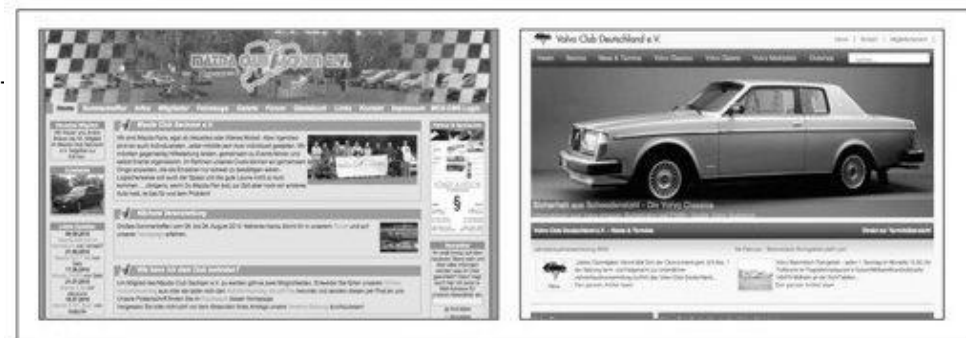
Abb. 5: Typische Websitedesigns von Anhängern modifizierter (Bild links) und originaler PKW (Bild rechts) 193

Abstand zwischen den Automobilen, die den Eindruck erwecken in gemütlichem Tempo (aber dafür ›beieinander‹) über die Straße zu gleiten.