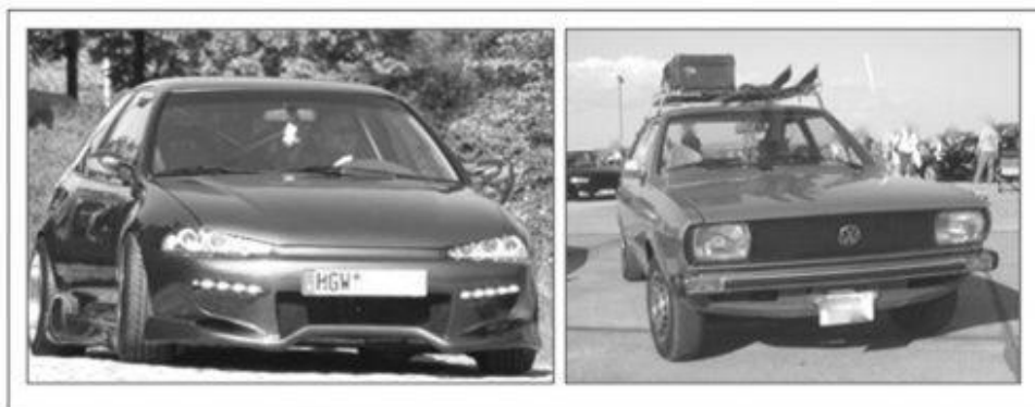
Abb. 3: Typische Automobile von Anhängern modifizierter (Bild links) und originaler PKW (Bild rechts) 9

Diskurse werden in Anlehnung an Siegfried Jäger als ›Felder des Sagbaren‹ verstanden (JÄGER 2001: 83). Das bedeutet: Diskurse sind Ensembles, die Aufschluss darüber geben, ›wer was wo wann‹ sagen darf. Demnach können die zentralen Bilder auf den Brand Community-Sites, wie Logos oder die Site prägende Gestaltungselemente, als von den Mitgliedern der BCs legitimierte Abbildungen und Aussagen verstanden werden, anhand derer sich essentielle Deutungen der Brand Communities innerhalb der Diskurse ableiten lassen. Neben Werthaltungen haben sich ›Artefakte‹, ›Praktiken‹ und ›Sprechakte‹ im Rahmen der Diskursanalyse der Community-Kultur als besonders fruchtbare Datenquellen erwiesen. Diese Erkenntnisse sind in ein erweitertes Modell der Markenkultur eingeflossen (Abb. 2), welches als Grundlage für die Bilddiskursanalyse gedient hat. Im Folgenden werden erstens Bilder von Artefakten, 8 zweitens Bilder von auf die Automobile bezogenen Praktiken und drittens (visuelle) Sprechakte der BC auf ihren Beitrag zur Klärung der Deutungsmuster kurz analysiert und dargestellt.