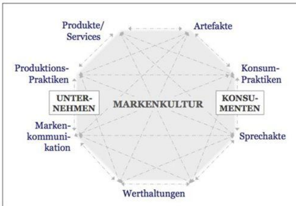
Abb. 2: Modell der Markenkultur